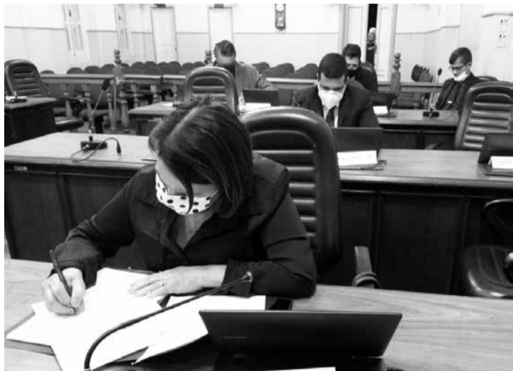
Reunião ordinária da Câmara Municipal de Teófilo Otoni, na segunda-feira (01-06-2020)