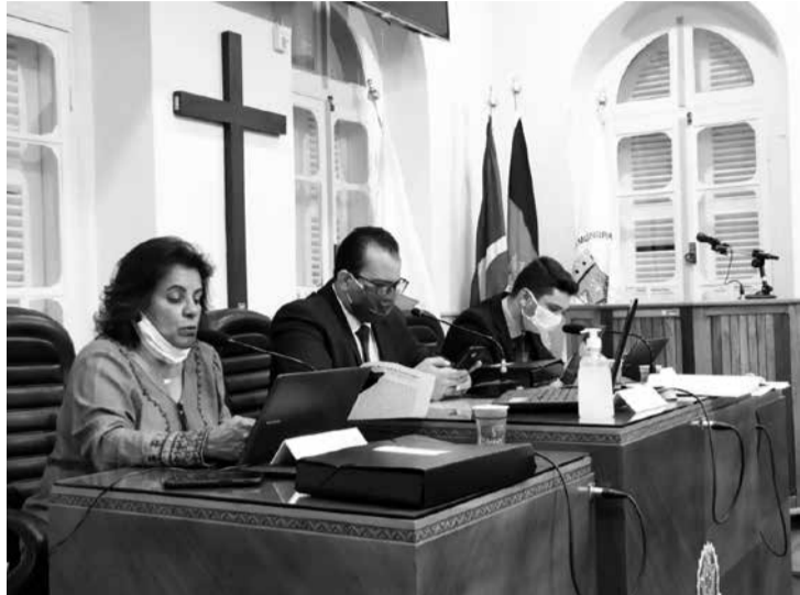
Mesa Diretora da Câmara Municipal, na reunião de segunda-feira (01-06-2020)