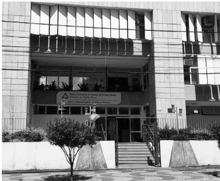
(Diário do Aço - Ipatinga)

Ipatinga fecha comércio - Em reunião do Comitê Gestor de Crise de Ipatinga ficou definido que diversos segmentos do comércio varejista do município serão fechados mais uma vez. Somente os serviços essenciais poderão seguir funcionando. A medida vai vigorar até o dia 10, quando uma nova avaliação será feita. Até lá, será permitido o sistema de entrega (delivery). Conforme explicou o prefeito Nardyello Rocha, a decisão foi tomada para se evitar o lockdown (fechamento total) e também para impedir a saturação do sistema de saúde em meio à pandemia da covid-19.