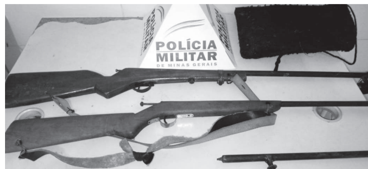
Armas de fogo apreendidas durante ação da Polícia Militar

A vítima estava caída no chão e apresentava um ferimento proveniente de disparo de arma de fogo no lado esquerdo do peito. Os militares isolaram o local e acionaram a perícia e IML. Testemunhas disseram que estavam em suas residências quando ouviram o barulho de tiro e viram o autor caminhando apressadamente pela