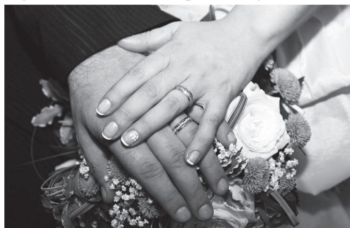
Cartórios do interior também poderão fazer casamentos por videoconferência

A ampliação se deu pela Portaria 6.049, que revoga a 6.045. Ao permitir o aumento do número de serventias a praticar atos pela plataforma digital, a norma considerou que a utilização