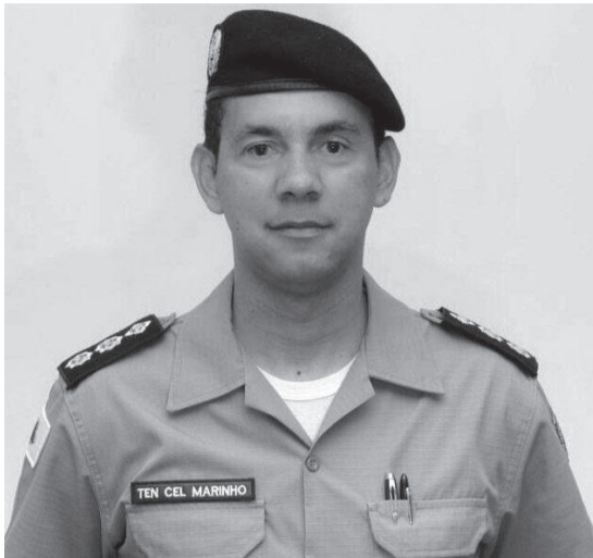
Tenente coronel Fábio Marinho deixou o comando do 19º BPM

Marinho desincompatibilizou do cargo na quinta-feira (03/06) e assumiu ser pré-candidato a prefeito de Teófilo Otoni