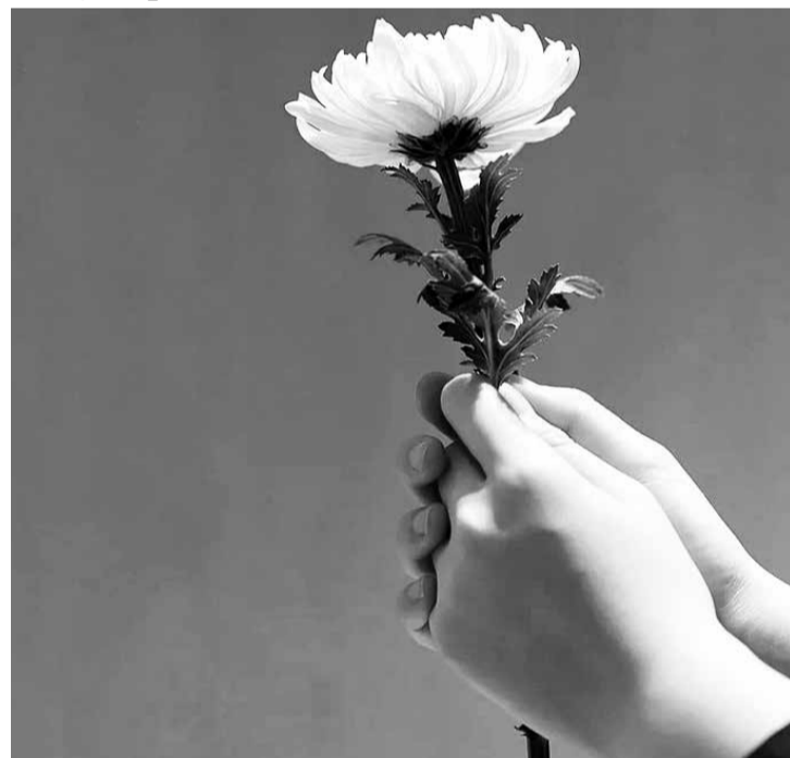
Pai da criança foi assassinado quando ela tinha apenas quatro meses de vida

Recurso - A mãe recorreu para pedir o aumento da indenização e da pensão, argumentando que o Estado foi omissivo por não ter garantido a integridade física do pai