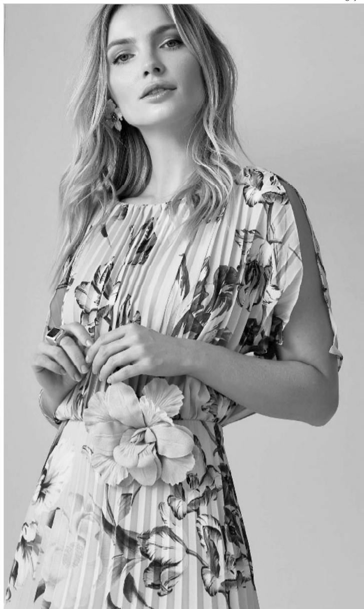
floral da Condotti

Os organizadores do Salão Casamoda (feira de moda realizada em São Paulo) não brincam em serviço. Além de confirmar a edição com lançamentos para o próximo verão (entre 7 a 10 de