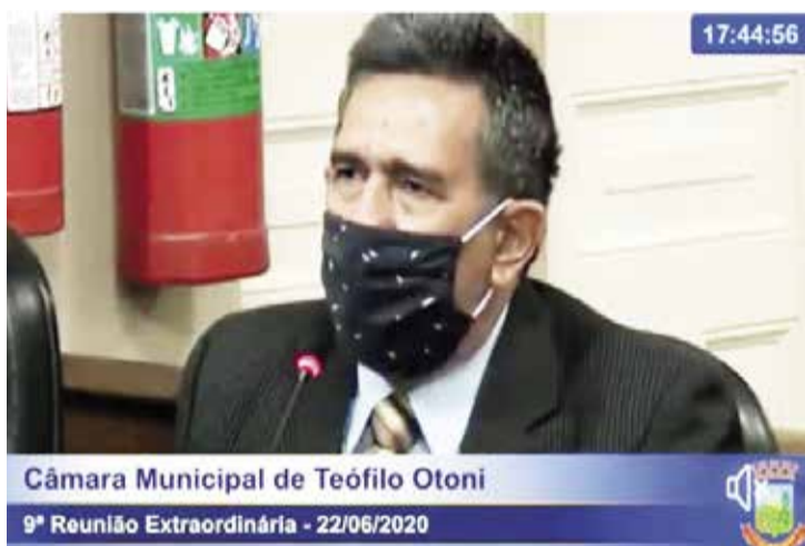
Câmara Municipal de Teófilo Otoni 9ª Reunião Extraordinária - 22/06/2020