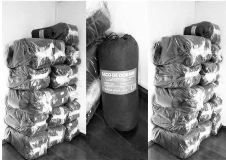
A campanha do Núcleo de Voluntariado do TJMG arrecadou mais de R$ 7 mil para a compra de cobertores e sacos de dormir

Em uma primeira etapa, foram adquiridos com os recursos 160 cobertores, entregues à Pastoral de Rua em 28 de maio. Em uma segunda etapa, encerrada nesta segunda-feira (22/6), foi possível a compra de 161 sacos de dormir — item que a Pastoral de Rua avaliou que seria menos perecível e poderia trazer mais conforto para os beneficiados.