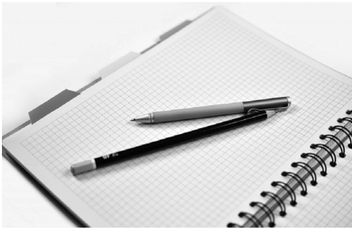
Relator frisou necessidade de reconhecer esforço do reeducando de se qualificar

O magistrado se baseou na Recomendação 44/2013 do Conselho Nacional de Justiça (CNJ), que aconselha a valorização de estudos feitos por presidiários por conta própria caso haja êxito em exames nacionais de seleção. O magistrado lembrou ainda jurisprudência do Su-