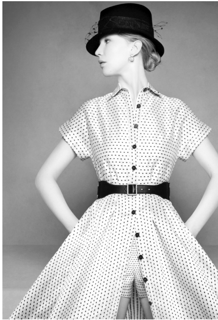
O inverno Dior: new look + shorts

A turma da moda na Europa está desesperada. O fato é que a primeira semana de moda apresentada de modo virtual, em Londres, não provocou interesse – e os acessos