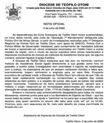
Operação realizada em Teófilo Otoni, Governador Valadares, Galiléia e Pavão

Após a operação "Sétimo Mandamento" deflagrada na última quinta-feira (02/07), pela Polícia Civil de Minas Gerais, através da 1ª Delegacia Regional de Teófilo Otoni, a partir de investigações que apuram supostos fatos ilícitos relacionados à disposição fraudulenta de imóveis de institutos de assistência social e da Igreja Católica localizados na cidade de Teófilo Otoni e região, a Mitra Diocesana de Teófilo Otoni se manifestou em nota, dizendo que as dependências da Cúria Diocesana também foram surpreendidas nesta data