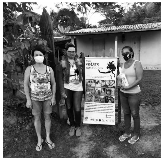
Entrega no Cedro