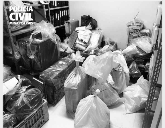
Materiais apreendidos da operação Sétimo Mandamento da Polícia Civil

Foram cumpridos 32 mandados de busca e apreensão nas cidades de Teófilo Otoni, Governador Valadares, Galiléia, Pavão e Itambacuri