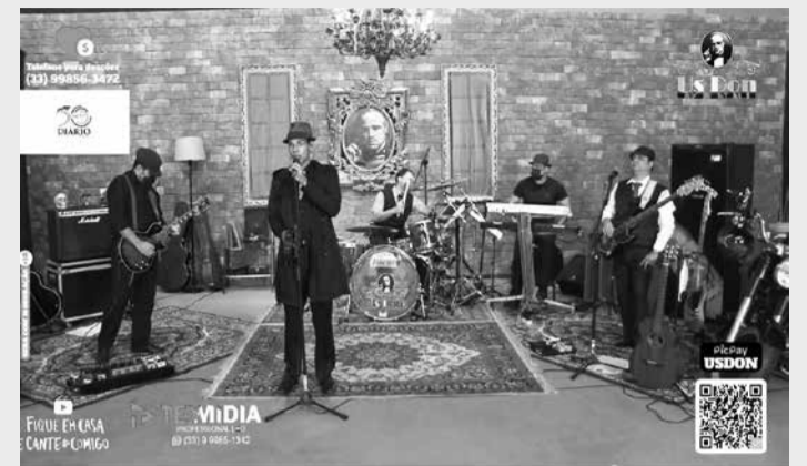
O Diário Tribuna apoiou o evento que foi sucesso total