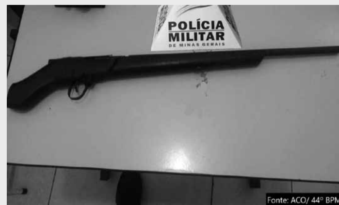
localizado e recapturado. Durante buscas no local foi encontrada e apreendida uma espingarda de fabricação artesanal carregada. O foragido e a arma apreendida foram encaminhados para a delegacia de Polícia Civil para as medidas cabíveis. (Informações/Foto: ACO 44° BPM, Almenara).

Os militares foram até a fazenda onde ele foi