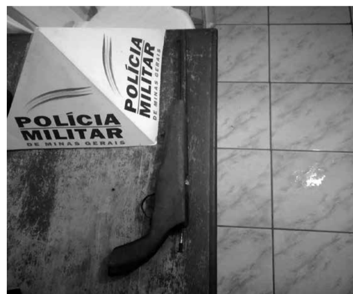
Os militares foram até o distrito, onde avistaram o suspeito tentando fugir, mas ele foi alcançado e detido. Submetido a busca pessoal, foi localizada com ele uma arma de fogo que foi apreendida e encaminhada à delegacia de Polícia Civil. (Informações/Foto: ACO 24ª Cia PM Ind, Nanuque).

Um homem foi preso na quarta-feira (15/07), portando uma arma de fogo no distrito de Água Quente, zona rural de Águas Formosas. A Polícia Militar foi acionada a comparecer ao Hospital Municipal em Águas Formosas, onde a vítima relatou ter sofrido agressões feitas pelo seu ex-amásio. Na sequência, os militares receberam informações que o autor das agressões estaria na residência da vítima no Distrito de Água Quente, portando uma arma de fogo e ameaçando as pessoas que se encontravam no local.