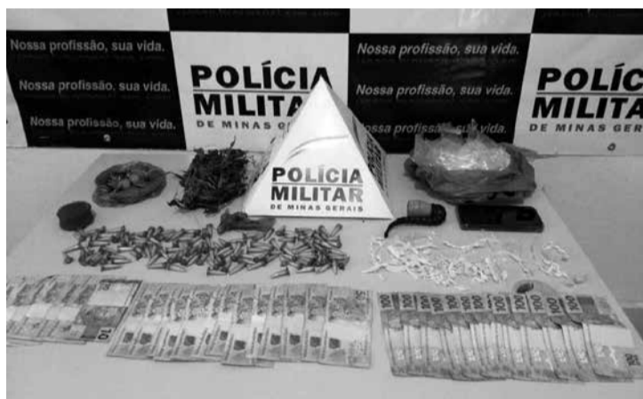
melhante a maconha, uma quantia em dinheiro e sacos plásticos comumente usados para embalagem de drogas. Duas pessoas foram conduzidas à delegacia de Polícia Civil com os materiais apreendidos. (Informações/Foto: ACO 24ª Cia PM Ind, Nanuque).

Na terça-feira (21/07), a Polícia Militar realizou uma operação para dar cumprimento a mandado de prisão na cidade de Machacalis. Os militares cumpriram o mandado em uma residência no centro da cidade e durante buscas no interior do imóvel localizaram 01 porção e 138 pinos contendo substância semelhante à cocaína, 125 pedras de substância semelhante ao crack, 01 cachimbo para consumo de drogas, 01 planta se-