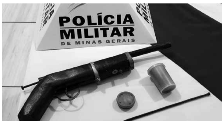
36. O menor infrator e as armas apreendidas foram encaminhados para a delegacia de Polícia Civil. (Informações/Foto: ACO 44° BPM, Almenara).