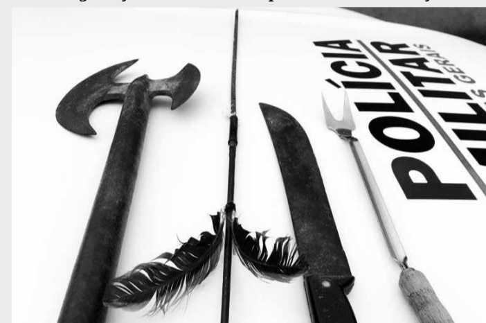
Materiais apreendidos na posse do homem que estava com surto psicótico e o filho de 11 anos como refém

Devido a integridade física da criança que estava em risco, os policiais fizeram contato com o pastor que compareceu ao local, permanecendo do lado de fora da casa. Ele pediu ao homem para liberar seu filho, mas o pedido não foi atendido. Por fim o homem pediu ao pastor para retirar-se do local. Devido à complexidade da ocorrência, o comandante da PM local assumiu a negociação, não resolvendo o problema foi necessário a intervenção do Batalhão de Operações Policiais Especiais (BOPE) de Belo Horizonte.