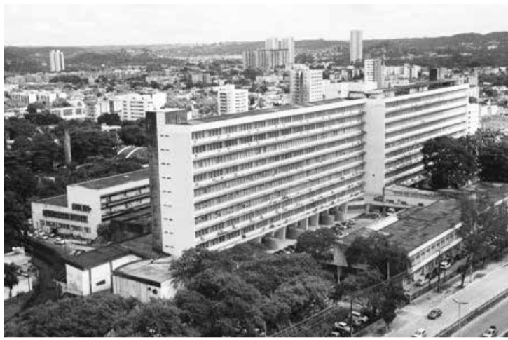
Samu Regional no Vale do Aço.

Samu Regional na fase final - A implantação da primeira fase do Samu Regional do Leste de Minas Gerais está mais próxima. O Consórcio Intermunicipal de Saúde da Rede de Urgência e Emergência do Leste de Minas (Consurge) entregou mobiliários e equipamentos para as quatro bases que vão atender a região do Vale do Aço, em Coronel Fabriciano, Belo Oriente, Caratinga e Timóteo. A previsão é até 15 de agosto entregar ao Governo de Minas toda a estrutura para o início da primeira fase de implementação. A partir daí vai ficar a cargo do Estado implementar, de fato, o