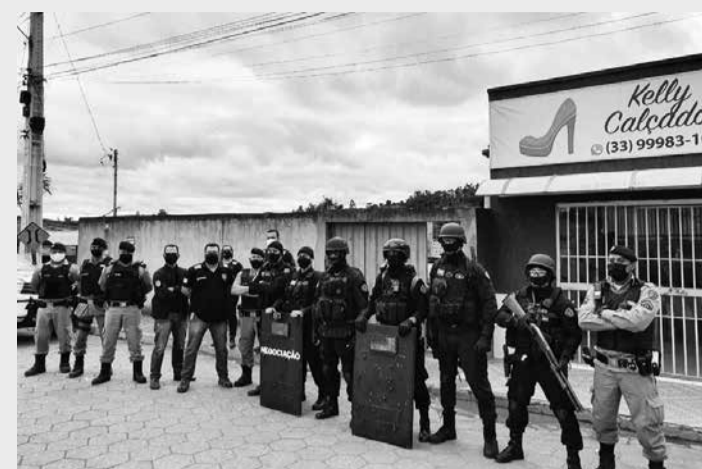
Equipe do BOPE de Belo Horizonte teve que intervir nas negociações com o homem para libertar a criança

Durante as negociações para libertar a criança, o homem pediu a presença de um pastor da cidade Capelinha.