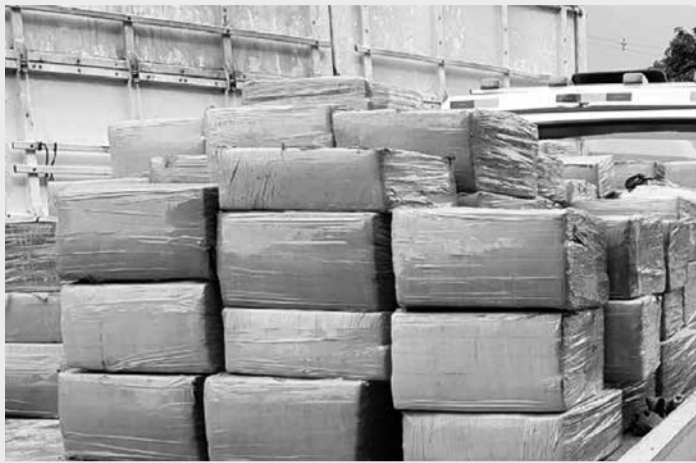
As duas apreensões de carga de maconha ocorreram nas cidades de Uberaba e Bataguassu

bando foi condenada pela apreensão de 823 kg de maconha a 8 anos e 2 meses de reclusão e 816 dias-multa. A mulher adquiria e distribuía a droga junto com o marido e fazia a comunicação com outro integrante da quadrilha. Pela mesma quantidade de droga apreendida, o condutor do veículo utilizado para o transporte de entorpecentes do Mato Grosso do Sul para a capital mineira foi condenado a 9 anos e 4 meses de reclusão e 933 dias-multa.