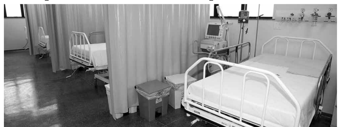
O paciente apresentou quadro de dor no peito e na garganta, tosse e desconforto respiratório, precisando de intubação em UTI