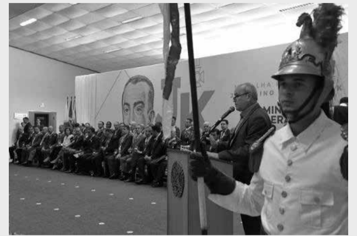
Comitê Covid-19 também cancelou cerimônias de entrega de medalhas, como a de JK, em Diamantina - (Arquivo ALMG - Foto: Clarissa Barçante)

A norma altera outra deliberação do comitê, de nº 45, que aprovou a reclassificação das fases de abertura das macrorregiões de saúde previstas no Minas Consciente. O plano setoriza as atividades econômicas no Estado em três ondas - vermelha, amarela e verde. A onda amarela é a de segunda fase, de média restrição de atividades socioeconômicas, e inclui serviços não essenciais. As ondas indicam qual o nível de abertura do comércio e da atividade econômica deve ser seguido, conforme indicadores de capacidade assistencial e de propagação da do-