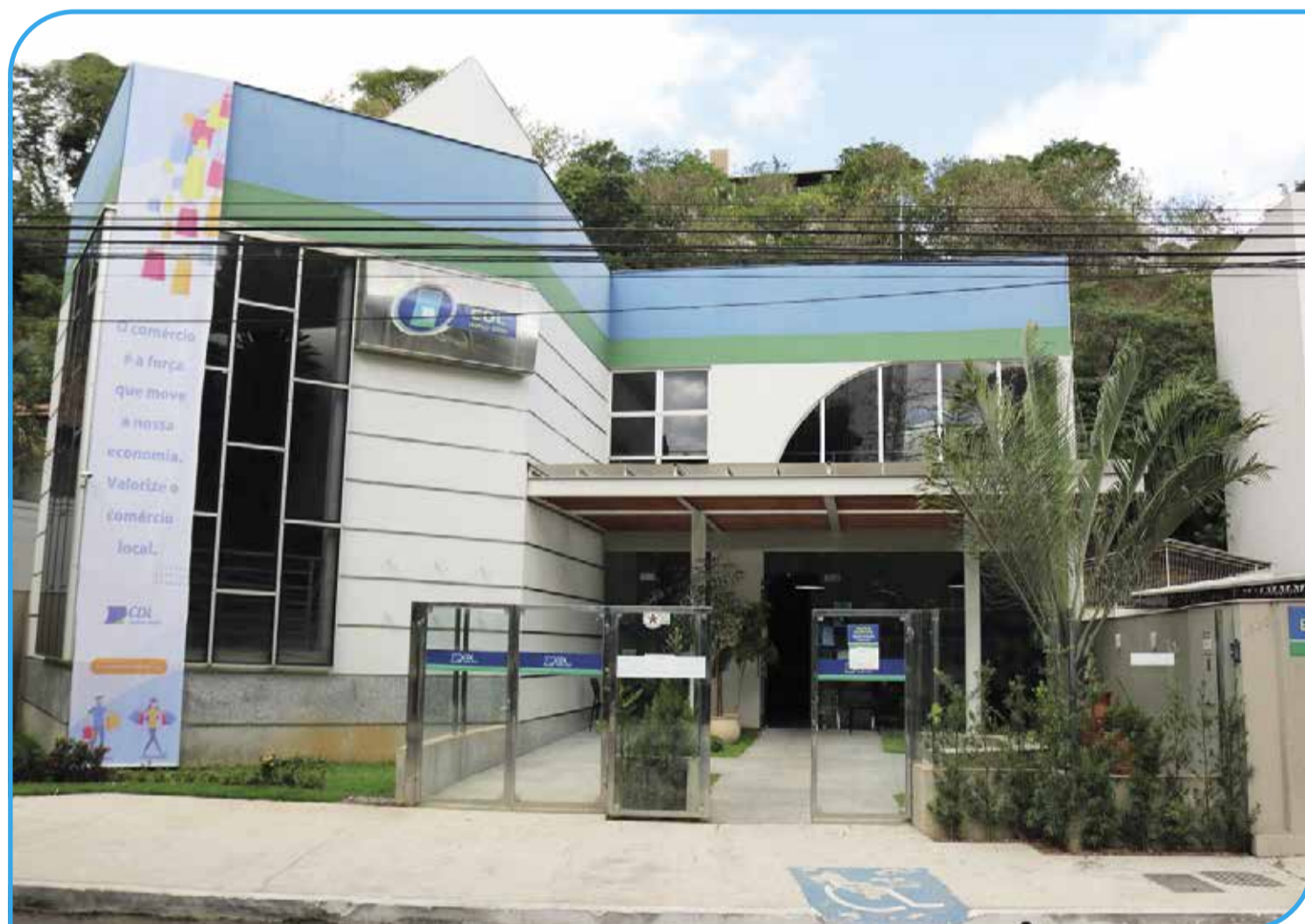
Câmara de Dirigentes Lojistas / TO está sempre nos primeiros lugares no ranking da Certificação Digital nacional

Ela enfatiza que, um resultado como esse impulsiona mais a equipe a continuar desempenhando um trabalho de excelência, é uma conquista que a CDL divide com os colabo-