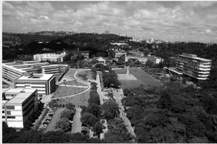
Campus da UFMG: estudante teve pedido de punição a órgãos de imprensa negado pelo TJMG

Sentença - Conforme o juiz Ather Aguiar, da 3ª Vara Cível da Comarca de Divinópolis, analisando a matéria jornalística em que está exposta a imagem da estudante, fica evidente que sua cor é