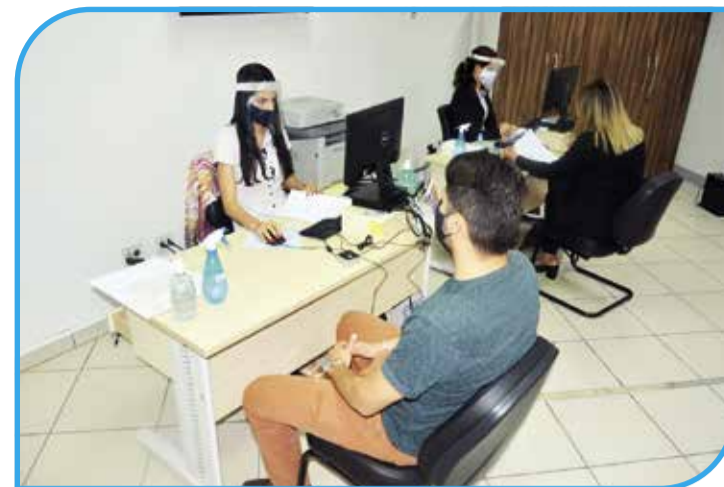
Um cliente em atendimento no setor de Certificado Digital, na CDL-TO