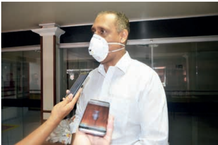
Deputado estadual Neilando Pimenta vem ajudando os municípios no combate à Covid-19

oriundos de Nanuque. “É o município da região com maior incidência de casos de Covid-19, onde nós precisamos a nível regional concentrar nossas forças para podermos fazer um combate mais específico no município”, disse. Na oportunidade Neilando agradeceu a presença de Maísa da Superintendência Regional de Saúde de Teófilo Otoni e pediu união de forças para o enfrentamento da Covid-19.