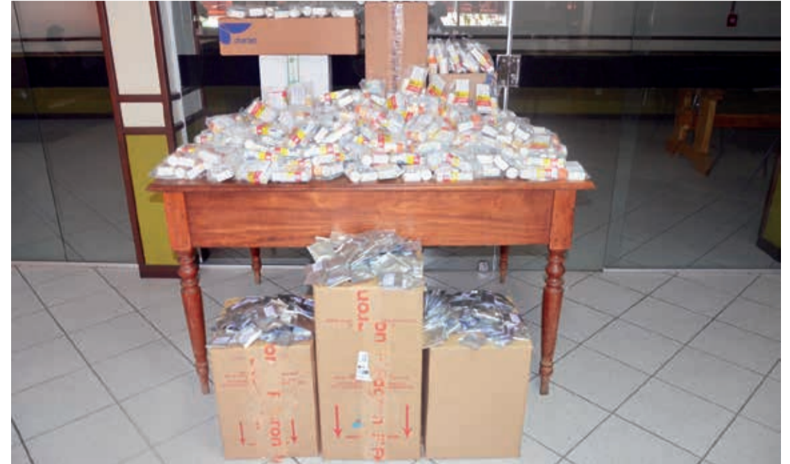
A princípio foram entregues 300 kits de medicamentos para Nanuque

“Considerando que Teófilo Otoni é uma cidade