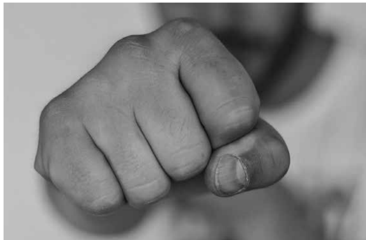
Ameaças e clima de insegurança eram vivenciados pela mulher e pelos filhos de 02 e 12 anos

A Polícia Militar foi acionada, por meio da Patrulha de Prevenção à Violência Doméstica, assim como o centro de referência dos direitos humanos, o conselho tutelar. Como a comarca não dispõe de casa de acolhimento, a titular da 2ª Defensoria Pública Criminal de Teófilo Otoni solicitou que o juiz determinasse