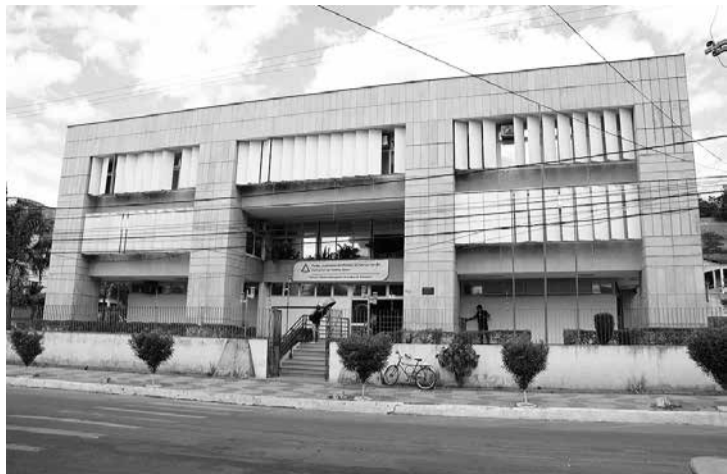
Judiciário e outras instituições se uniram para evitar dobramentos trágicos de caso envolvendo pai de família

Em Teófilo Otoni, atuação do TJMG e da Defensoria encerra abuso