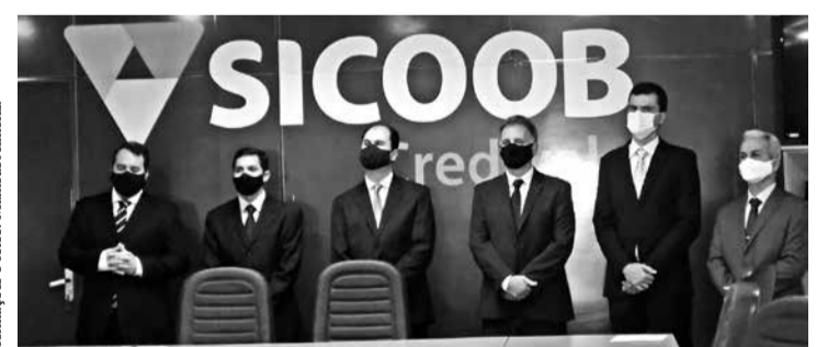
Informações e fotos: Mathheus Almeida

Após Assembleia Digital Sicoob Credivale empossa Novo Conselho de Administração e Diretoria Executiva