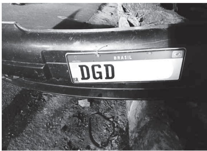
Veículo GM Astra emplacado na cidade de Itaquaquetuba-SP envolvido no acidente

nota às 15h de sábado (12), informando que, os corpos das vítimas continuavam sem identificação. Que um dos veículos envolvidos era um GM Astra emplacado na cidade de Itaquaquetuba-SP. O Astra trafegava no sentido Minas Gerais a Bahia. Se alguém conhecesse pessoas que moram na grande São Paulo, especialmente em Itaquaquetuba fizessem chegar