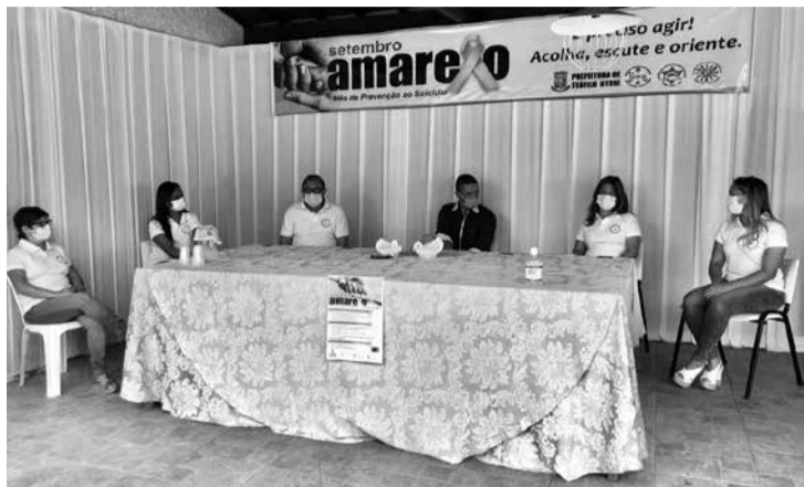
Abertura da Campanha Setembro Amarelo em Teófilo Otoni