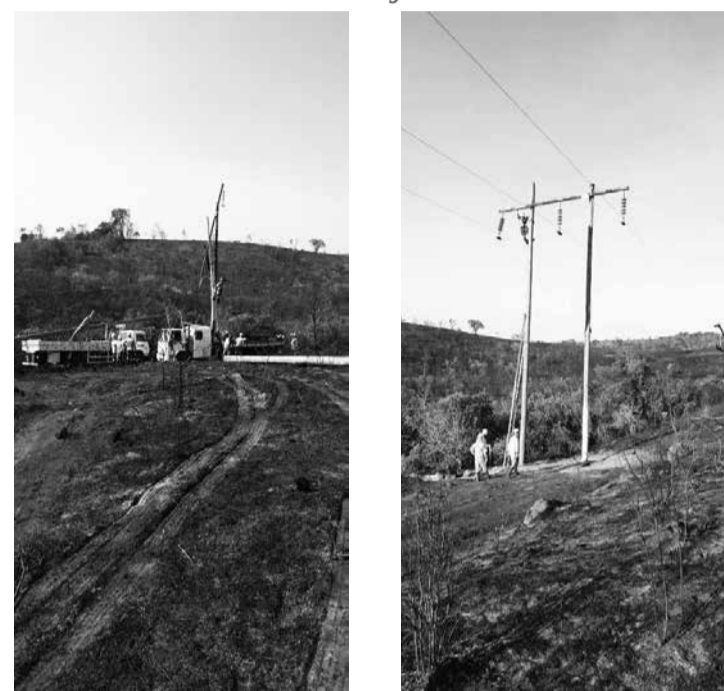
Equipes da Cemig trabalham para restabelecer o fornecimento de energia em ocorrência no Triângulo Mineiro

"O aquecimento dos cabos e equipamentos da rede elétrica pode levar