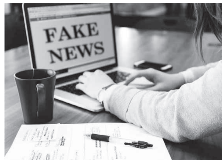
Ativista política e social teve na Justiça o direito de ver excluídos endereços eletrônicos que a difamaram

Assim, ele deferiu a liminar, determinando que, no prazo de 48 horas, as empresas responsáveis pelas redes sociais tornem indisponíveis os conteúdos a que se referem as URLs indicadas, e que, no prazo de 10 dias, informem os dados pessoais referentes aos perfis citados, de forma que seja possível identificar os autores das postagens. A