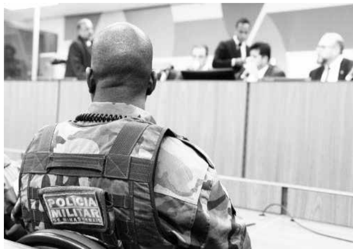
Associações de classe ainda alertam para a sobrecarga de trabalho e a não nomeação de concursados

Na reunião realizada no último dia 22/09, representantes dos sindicatos e associações de