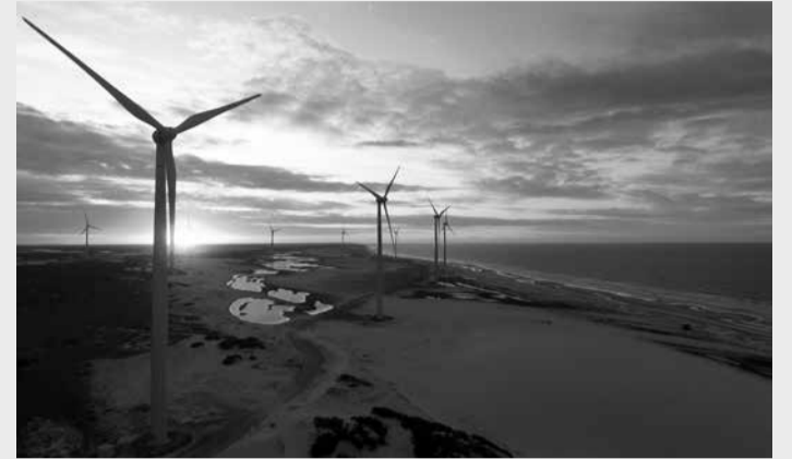
O Parque Eólico Parajuru, da Cemig, fica no Ceará e possui 19 aerogeradores.

Atualmente, a Cemig possui cerca de 6 GW de capacidade instalada de energia elétrica. A empresa possui dois parques eólicos localizados no Ceará: Parajuru,