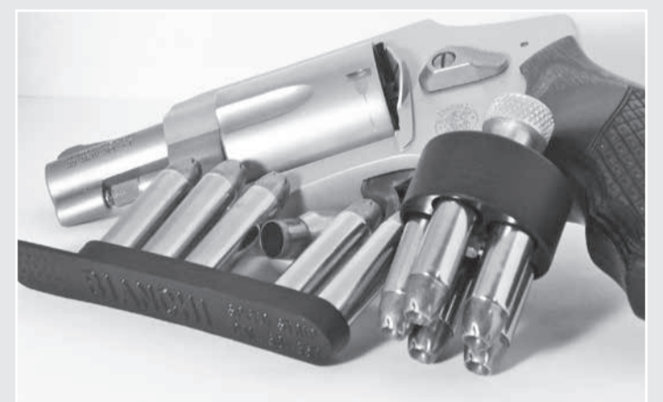
Armas e munições estavam entre os itens apreendidos

Homofobia - Uma das ocorrências relacionadas à prisão preventiva foi uma tentativa de homicídio motivada por homofobia. No caso, a investigação apurou que o autor sempre debochava da sexualidade da vítima e, no dia dos fatos, afirmou que "não queria homossexual residindo no bairro". A vítima, ao dizer que registraria ocorrência policial, foi alvejada com um disparo de arma de fogo que lhe atingiu a cabeça. O juiz Thales Taipina considerou presente a probabilidade de reiteração criminosa, salientando que a motivação do crime "não está em um fato isolado ou em