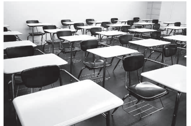
Decisão do TJMG determina que jovem portador de autismo permaneça em escola onde já tinha atendimento especializado

Integração - O relator, desembargador Carlos