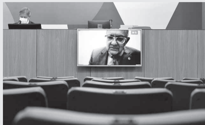
Parecer foi votado com a participação remota de integrantes da comissão