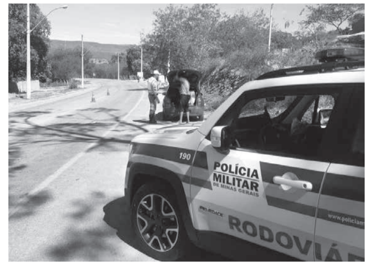
Operação Padroeira será realizada de 9 a 12 de outubro

- Nunca consumir bebida alcoólica ou drogas e dirigir; - Ultrapassar somente em trechos permitidos e necessários: a ultrapassagem é um dos momentos mais críticos e perigosos, sendo necessário observar, analisar e confirmar se é viável realizá-la naquele momento. Lembrem-se que mais a frente teremos outras oportunidades de ultrapassar com maior segurança; - Manter a distância de segurança do veículo da frente para evitar colisões traseiras: o motorista observa um ponto fixo logo e assim que o veículo da frente passar por ele, realiza a contagem 51, 52, 53. Passando pelo mesmo ponto após o 53, considera-se uma distância segura. Atenção: Na MGC-418 em Mayrink e chegando em Nanuque, todos os anos ocorrem aci-