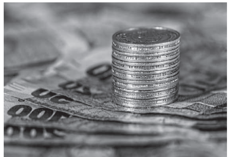
Empréstimo não foi autorizado por cliente e era desconto de conta indevidamente

Dignidade lesada - Para o desembargador re-