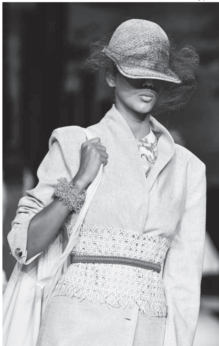
Acessórios: complemento fashion

• O Salão Casamoda está a todo vapor. Mercado para ir ao ar em novembro, em São Paulo, está conta-