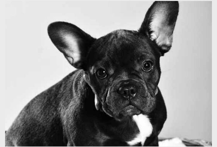
Cão perdido em Lagoa Santa é da raça buldog francês

Mensagens ofensivas - De acordo com o processo, o casal encontrou na rua um cão da raça buldog francês. O animal estava perdido e sem identificação. Segundo o casal, o cão estava machucado e necessitando de cuidados. Diante disso, eles o levaram para a casa. Dias depois, se depararam com um cartaz afixado no poste com a palavra "Procura-se" e uma foto do buldog, oferecendo a recompensa de R$ 1 mil. Eles então ligaram para o telefone identificado no cartaz para devolver o cachorro. Porém, além de não pagar a recompensa, o proprietário divulgou