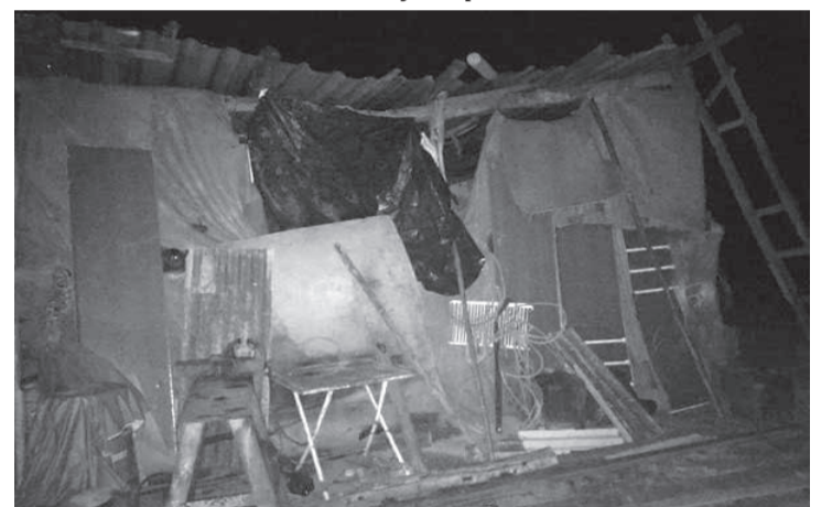
Benedito foi encontrado em um barraco de lona, com telhado de folha de zinco, sem energia elétrica e água encanada