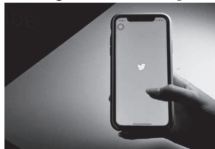
Vítima de publicação alega danos morais por conteúdo inverídico e ofensivo

De acordo com o pedido do comerciante, nos meses de junho e julho deste ano, houve no Twitter uma onda de relatos e desabafos de pessoas que vivenciaram ou conheciam outras que viviam relacionamentos "tóxicos" (relacionamentos marcados por abusos físicos, psicológicos e sexuais). O comerciante alega que foi surpreendido ao descobrir que a irmã da jovem com quem se relacionou por um breve período em 2016 participou do movimento, porém fazendo publicações em nome da irmã. Nesses posts, ela o acusava de violência psi-