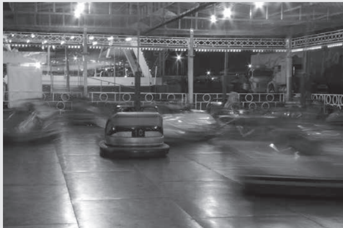
Menino de 7 anos estava brincando no carrinho bate-bate e o equipamento começou a pegar fogo

O parque argumentou na Justiça que o acidente não foi comprovado. O argumento foi de que o brinquedo utiliza baixa voltagem e, em caso de incêndio, não geraria as queimaduras na criança. Ressaltou que não há fiação no carrinho e que existe um disjuntor programado para desarmar em caso de superaquecimento. O centro de diversões afirmou ainda que, em