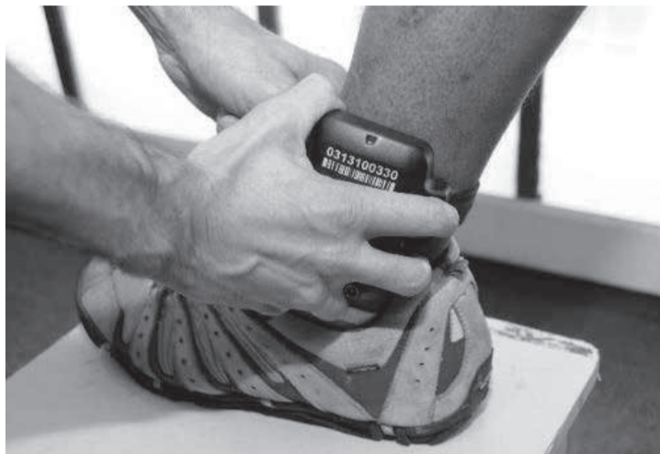
Atualmente, cinco mil condenados fariam uso de tornozeleiras eletrônicas em Minas

Segundo o parlamentar, informações encaminhadas ao seu gabinete indicam que o setor de inteligência que cuida da monitoração se encontra com graves problemas decorrentes, principalmente, da falta de efetivo, tendo em vista que atualmente haveria 5 mil