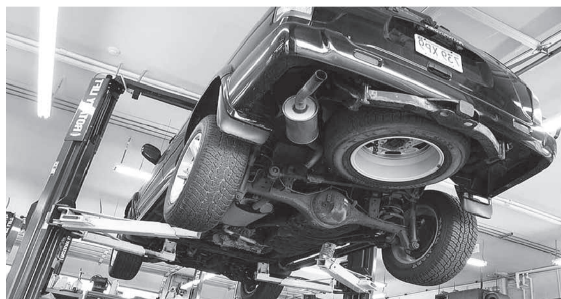
Veículo com o chassi modificado passou de mão em mão até que a irregularidade fosse descoberta

A juíza também afastou a alegação de que o Estado de Minas Gerais deveria ser responsabilizado, pois, ainda que o Departamento de Trânsito não tenha apurado a adulteração do chassi nas várias transferências de titularidade do veículo, isso não o torna responsável