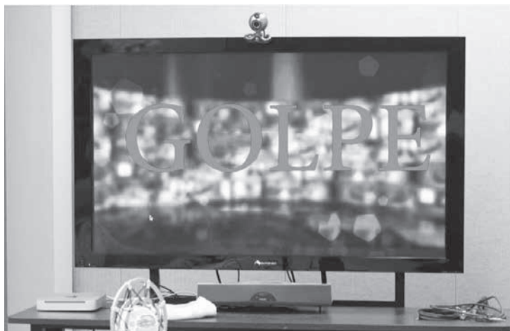
O consumidor precisa ficar alerta antes de realizar qualquer arrematação por meio de leilões eletrônicos

O alerta foi dado pela Corregedoria-Geral de Justiça de Minas Gerais após diversas consultas públicas feitas por pessoas que tiveram acesso a esses sites falsificados na internet. "A facilidade de registrar uma página na internet contribui para a multiplicação desse tipo de golpe, que vem ocorrendo às centenas em todo o País", destaca o juiz auxiliar e superinten-