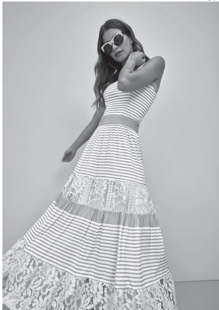
O estilo 'breeze' da Fleche d'Or

• O circuito da moda anda agitado com tantas compras, vendas e