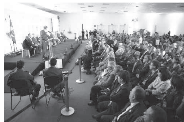
O aumento do número de pessoas em eventos deve observar, segundo a deliberação, as regras sanitárias

O artigo 6º determina que os municípios devem suspender todos os serviços, comércios, atividades ou empreendimentos, públicos ou privados, com circulação ou potencial aglomeração de pessoas. Em seu inciso I coloca no rol dessas atividades eventos públicos e privados de qualquer natureza, em locais fechados ou abertos, com público superior a trinta pessoas. O número, a partir da mudança, não poderá ser superior a 500 pessoas, observadas as regras sanitárias e a quantidade de pessoas por metro quadrado, de modo a se evitar aglomeração.