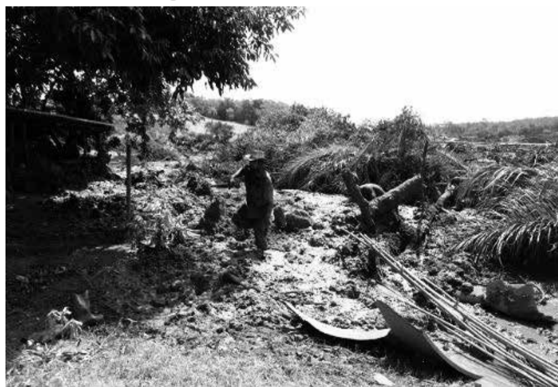
Segundo estudo, consequências emocionais de tragédias como a de Brumadinho seriam enormes

Convidados - Para a audiência desta quinta (5), já estão confirmadas as presenças da assessora do Centro de Referência