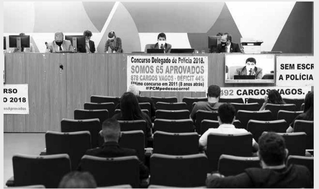
Comissão tem realizado uma série de audiências sobre a recomposição dos efetivos

Em audiência, secretário de Planejamento diz que Estado ainda não identificou fonte de receita para novas nomeações