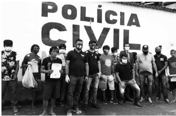
Índios maxakalis tiveram documentação regularizada para votar no próximo domingo, possibilitada pelo Judiciário e Polícia Civil locais