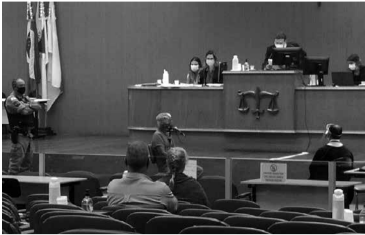
C.L.F. é acusado de tentativa de homicídio contra trabalhador do Acampamento Terra Prometida

Homem já foi condenado em outro processo por crimes contra sem terra no município de Felisburgo