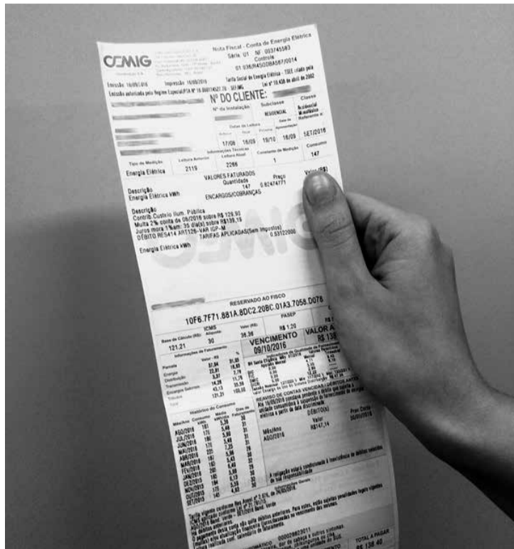
Clientes devem ficar atentos ao encerramento de contrato em caso de mudança de imóvel

Como fazer o encerramento do contrato - Para fazer o encerramento do contrato com a Cemig, o cliente pode utilizar a agência virtual no site da Companhia (www.cemig.com.br). Durante a soli-