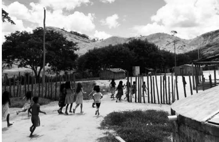
Uma das aldeias maxakalis na região Nordeste de Minas Gerais