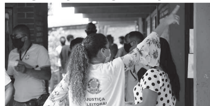
Primeiro turno das eleições municipais 2020, neste domingo, 15 de novembro, tiveram nove parlamentares da ALMG concorrendo a prefeituras