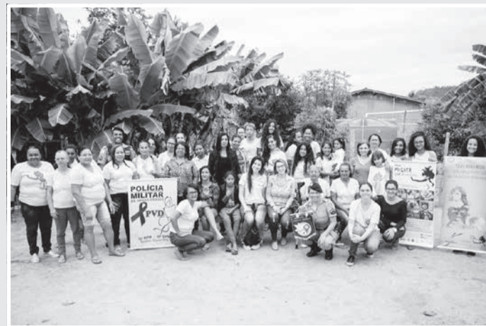
Atividade realizada em 2019

“Desde 2015, A AFAS apoia projetos sociais coordenados por policiais e bombeiros militares em todo o estado de Minas Gerais. Como parte deste fomento, a AFAS organiza anualmente o Encontro Militar de Mobilização Social. Para dar mais energia aos dedicados militares e para fortalecer a capacidade de divulgação de suas ações sociais, a AFAS sorteou 4 máquinas fotográficas semipro-