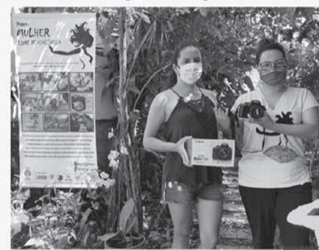
Câmera Fotográfica Canon EOS Rebel T100

Projeto Mulher Livre da Violência da cidade de Teófilo Otoni, que participou do Encontro Militar de Mobilização Social - EMMOS, ganha no sorteio uma máquina fotográfica.