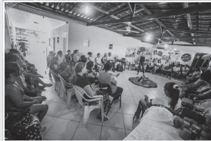
Último dos encontros realizados FEV 2020

Projeto Mulher Livre da Violência da cidade de Teófilo Otoni, que participou do Encontro Militar de Mobilização Social - EMMOS, ganha no sorteio uma máquina fotográfica.