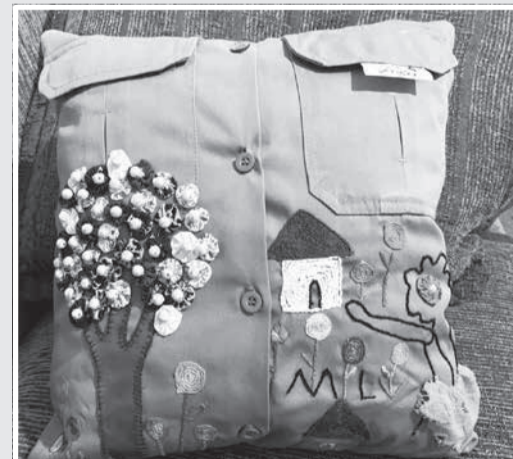
Almofada bordada em tecido de farda PM