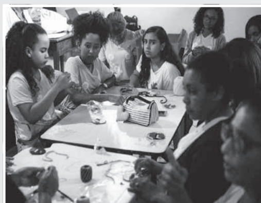
Registro de atividade em 2018