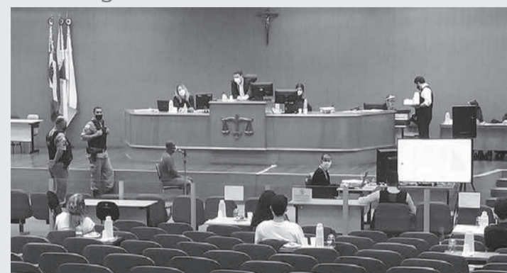
O 1º Tribunal do Júri de BH julga homem acusado de feminicídio e de tentativa de homicídio

Julgamento - O júri foi realizado no 1º Tribunal do Júri de Belo Horizonte com início às 9h50 desta quinta-feira (03/12). Pela manhã, fo-