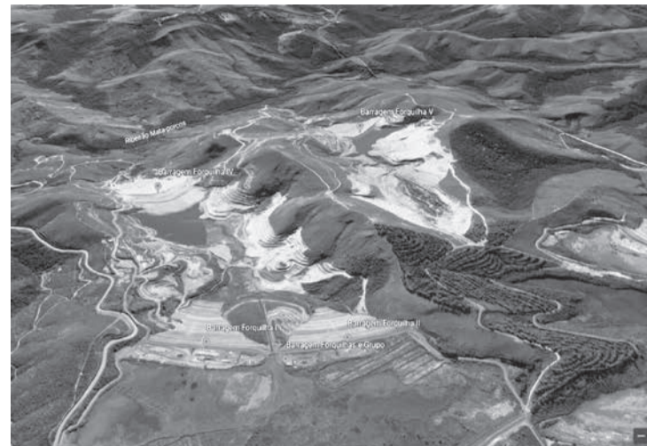
Os planos de manutenção, inspeção e monitoramento envolvem as barragens Forquilhas I, II e IV do Complexo Mina da Fábrica

A Vale já havia realizado testes para corte e remoção do excesso de vegetação das barragens, manutenção de instrumentos e limpeza do sistema de drenagem das estruturas. No entanto, a auditoria técnica Rizzo International, que auxilia o Ministério Público de Minas Gerais (MPMG) e o Ministério Público do Trabalho (MPT), negou-se a dar prosseguimento à autorização para a mineradora