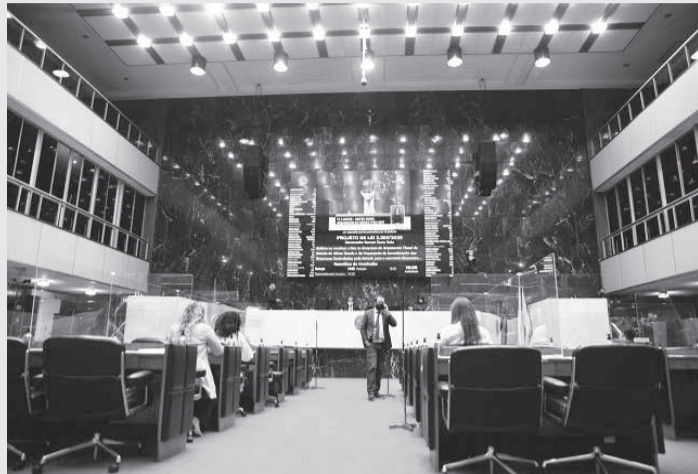
Os três projetos foram aprovados de forma definitiva nas reuniões de Plenário da tarde e da noite na sexta (04/12)

Segundo o PL, a redução para até 0% do ICMS é relativa à energia fornecida pela distribuidora à unidade consumidora do sistema de compensação de energia elétrica. O benefício terá que ocorrer em quantidade correspondente à energia vinda