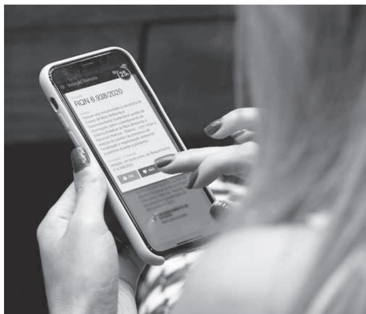
Análise dos 48 requerimentos utilizou recursos que permitem a votação a distância

Um dos requerimentos aprovados, de autoria da Comissão de Saúde, pede um "detalhamento do plano para a efetiva vacinação da população contra a Covid-19 em Minas Gerais, bem como da política a ser adotada pelo Governo do Estado para a aquisição da referida vacina". Um requerimento relacionado, desta vez da Comissão de Educação, é para saber se existe plano específico para a vacina-