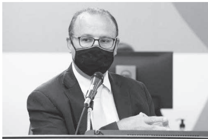
O representante da Sede disse que a Cemig precisa se modernizar, mas pontuou que o caminho para isso seria por meio da privatização

Para Gil Pereira, o Estado avançou em vários pontos em prol do desenvolvimento da economia, mas a Cemig não estaria dando vazão à geração e distribuição de energia a empreendimentos já instalados ou em instalação no Estado, e que dependeriam