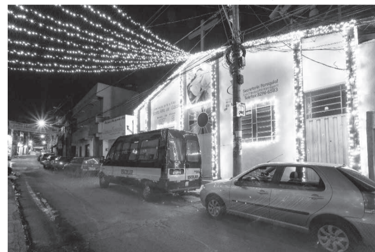
Enfeites em áreas externas merecem atenção especial devido a exposição a elementos naturais como vento e chuva, além da distância de segurança em relação à rede elétrica.

A instalação de ornamentos luminosos em áreas externas merece