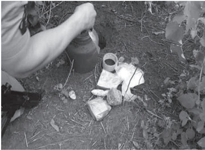
Drogas e armas foram encontradas no jardim da casa

munhas é absolutamente coerente e compatível com a própria confissão do acusado, que indica a posse consciente de "vultosa quantidade e variedade de entorpecentes, assim como de arma de fogo e relevante quantidade de munições". Ainda segundo o juiz, "o profundo comprometimento do réu com o tráfico de entorpecentes é amplamente detalhado nos dados extraídos de seu aparelho celular, retratado em conversas e fotografias de substâncias ilícitas, indicativos veementes da sua prática delitativa". Durante a abordagem, o réu tentou fugir e apresentou documento falso, segundo testemunhas. O réu negou esse fato, mas sua versão se encontra isolada nos autos. Para o juiz, ficou clara