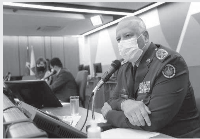
Comandante do Corpo de Bombeiros (à direita) admitiu um déficit de 22% no efetivo da instituição.

A demora na convocação dos concursados tem sido uma preocupa-