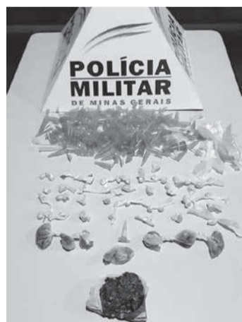
O Grupo Especializado em Patrulhamento em

Área de Risco (GEPAR) do 19º Batalhão de Polícia Militar fez uma batida policial no Bairro Manoel Pimenta (Morro do Eucalipto), na segunda-feira (30/11), quando os militares visualizaram alguns indivíduos supostamente traficando drogas. Com a aproximação dos policiais eles fugiram e não foram mais localizados.