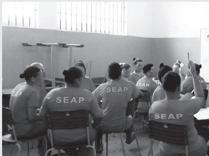
Cemig vai promover a cultura de eficiência energética a 133 agentes penitenciários e cerca de 1.300 recuperandos no estado

A Cemig promove, por meio das iniciativas do PEE, a utilização