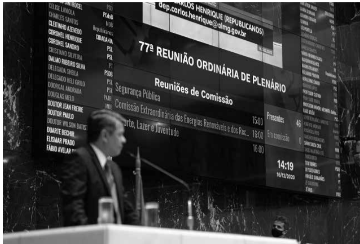
Mudança na diretoria da Emater foi interpretada pelos deputados como ameaça à autonomia da empresa