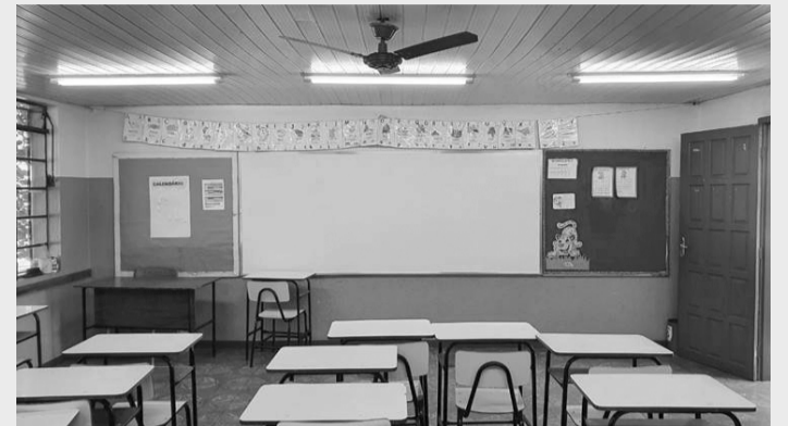
Escolas estaduais de Minas Gerais estão recebendo iluminação de LED pelo programa de eficiência energética da Cemig

Segundo o Gerente de Eficiência Energética