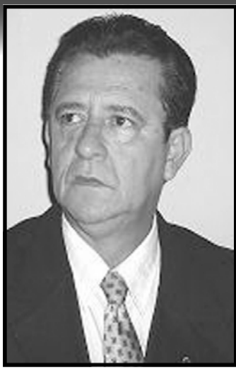
Por: Alfredo Ferreira Filho

Posse dos prefeitos e vereadores - Estamos a postos para fazer a cobertura das posses de alguns prefeitos do Médio Mucuri, caso tenha interesse por parte dos que irão empossar. A perspectiva é muito boa para um novo ano, com uma nova vacina e muito trabalho. Hoje dia 16, aconteceram as diplomações dos eleitos de Bertópolis. A cerimônia aconteceu no