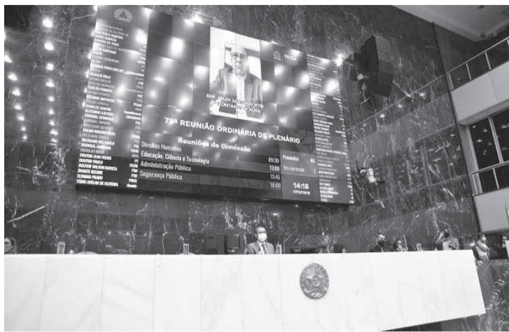
Deputados se manifestaram, presencial e remotamente, destacando a importância da obra rodoviária para a região