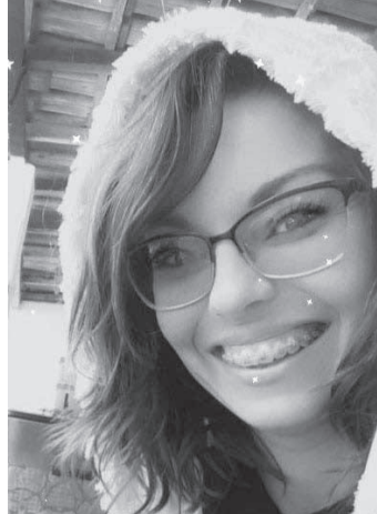
Livre de violência