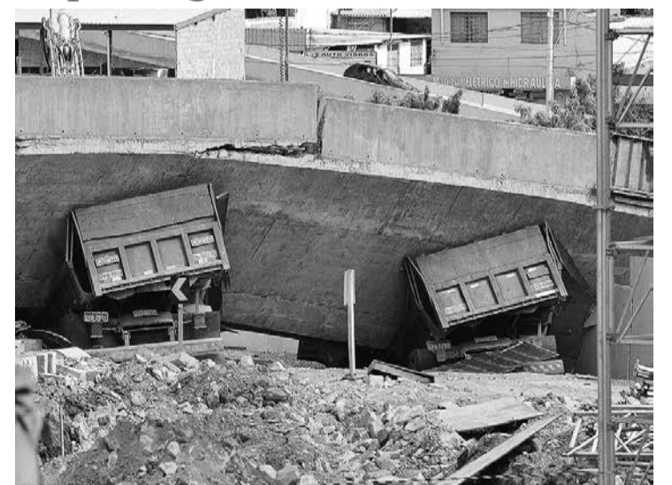
Os condenados são diretores, coordenador-técnico e engenheiros responsáveis pelas construtoras Cowan e Consol, além de supervisor, diretor e secretário de Obras da Sudcap

O engenheiro da Cowan, O.V.C., condenado por crime doloso (dolo eventual), não teve o direito a essa substituição. Ele foi condenado a 4 anos e 8 meses de prisão porque era responsável por fiscalizar as obras do viaduto e foi avisado dos estalos antes da queda. "Ele deveria ter interrompido o trânsito, evitando assim que vidas fossem ceifadas e lesionadas",