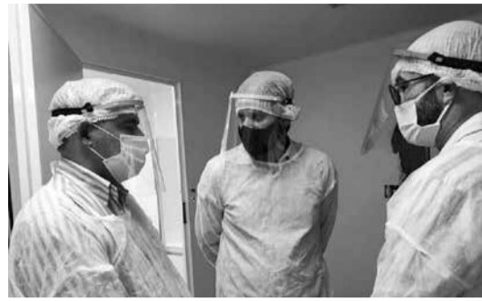
Apresentação do laboratório