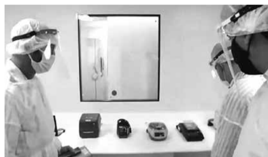
Uma das salas do laboratório