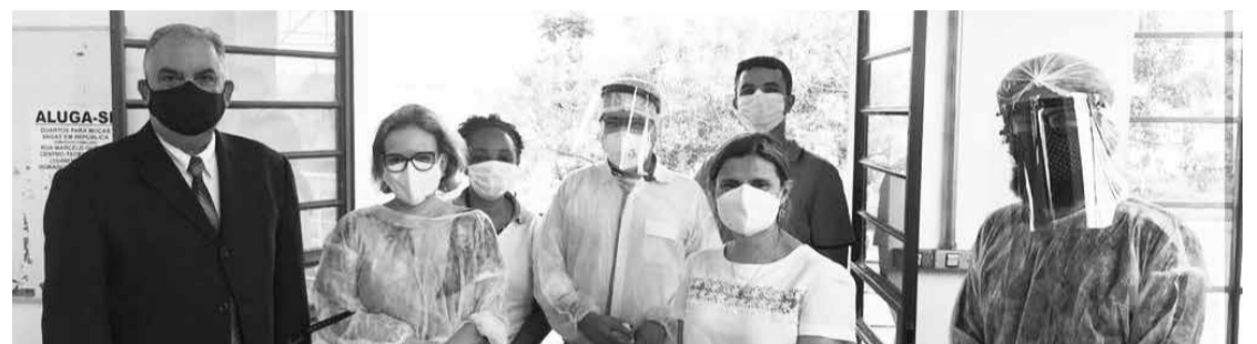
Representantes OAB com Unimed e da Prefeitura Municipal de Teófilo Otoni

Naterça-feira, 22/12/2020, o Laboratório de Pesquisa e Diagnóstico em Biologia Molecular, estruturado no Campus Mucuri, da Universidade Federal dos Vales do Jequitinhonha e Mucuri – UFVJM, foi apresentado em cerimônia oficial pelos membros do Comitê Técnico, Científico e Multidisciplinar - CTCM - à sociedade em geral e às autoridades, em particular.