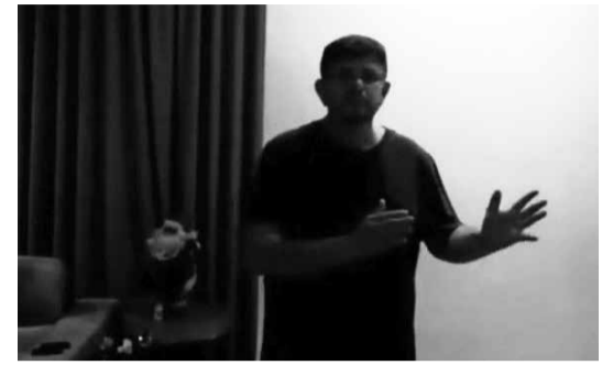
Deputado Federal Fábio Ramalho