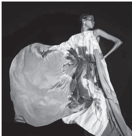
Modelos lançados pela SPFW em 2020