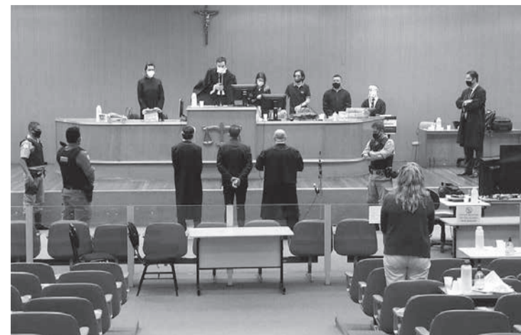
Sentença de condenação foi anunciada depois de quase 14 horas de trabalho no Tribunal do Júri

Segundo o MP, o crime foi cometido com recurso que dificultou a defesa da vítima, pois A.A.S. foi acusado de surpreender o casal enquanto dormiam e