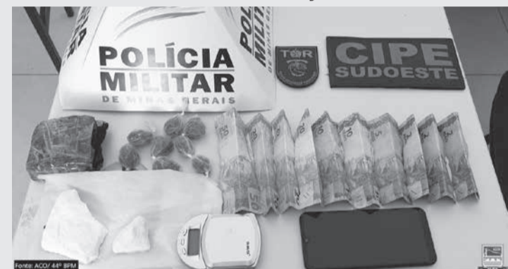
Operação em Mata Verde