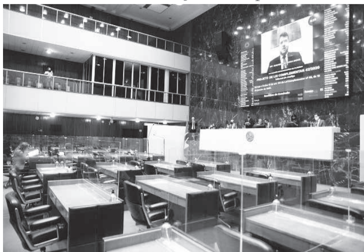
Da forma como foi votado, PLC teve seu conteúdo ampliado

Os deputados aprovaram o projeto na forma do substitutivo nº1 ao texto que havia sido votado no 1º turno (vencido). Esse novo texto foi apresentado pela Comissão de Administração Pública e incorpora mudanças