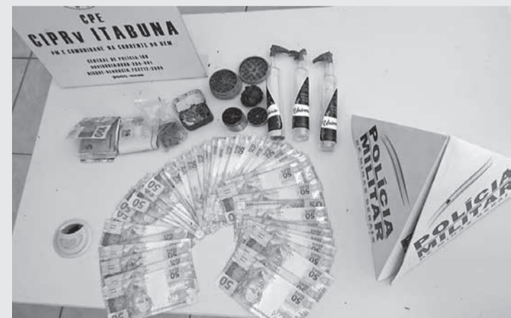
Operação em Salto da Divisa