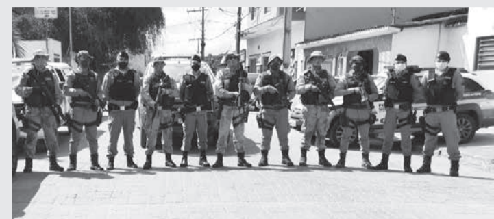
Cidade de Mata Verde

Durante a operação foram feitas abordagens a pessoas e veículos, sendo apreendidos 15 pés de maconha, 01 tablete, 10 buchas e 01 porção da mesma droga, 02 pedras de crack, 03 frascos de lança perfume, 01 arma de fabricação artesanal e R$3.196,00 em dinheiro. Foram presos cinco suspeitos com idade entre 21 e 42 anos por envolvimento no tráfico de drogas, sendo conduzidos à delegacia de Polícia Civil junto com os materiais apreendidos. (Assessoria de comunicação organizacional do 44º BPM, Almenara).