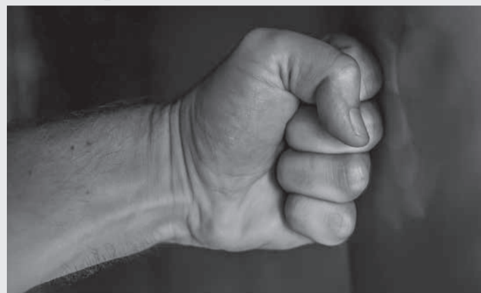
Aborto foi causado em razão dos socos e golpes de madeira desferidos pelo homem contra a companheira

Recurso - A defesa do acusado pediu a concessão da liberdade provisória e a absolvição do crime de lesão corporal que resultou no aborto. Em seus argumentos,