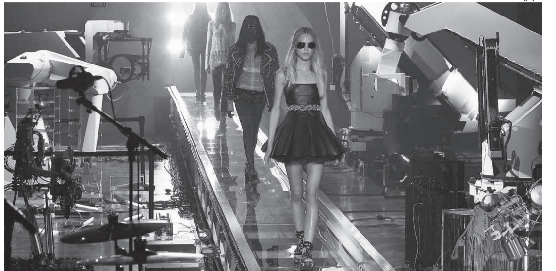
Fashion + tech: a moda versão 4.0