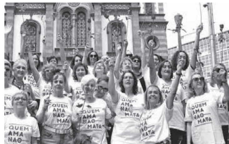
Repúdio a sentença de juiz de SC em 2020

qualquer, num espetáculo protagonizado pelos advogados da época, tanto em sede de tribunal, por meio de suas performances ou disputados torneios de oratória na cena do júri, quanto em suas defesas para formação da opinião pública em jornais e publicações jurídicas.