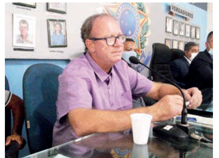
Pronunciamento do prefeito Aristides Ângelo Depolo