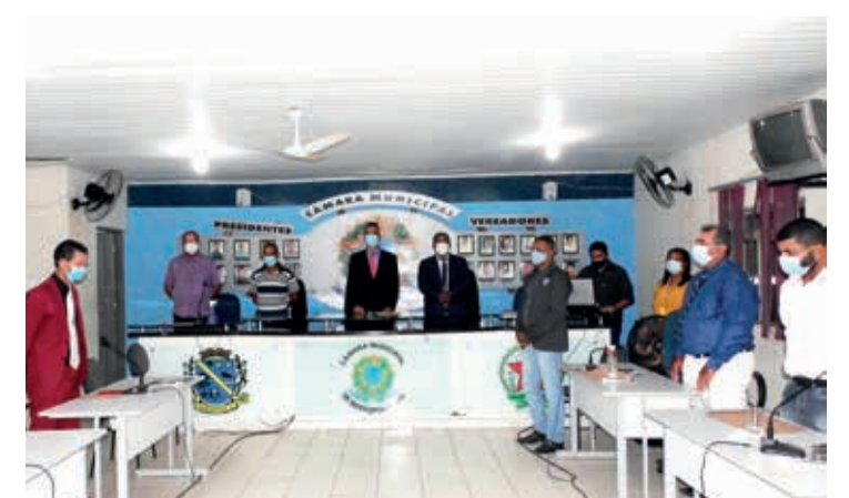
Momento da execução do Hino Nacional Brasileiro