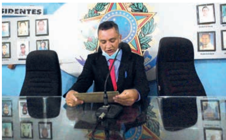
Presidente fez a abertura da sessão Solene de posses