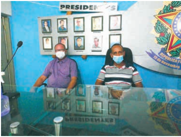
Prefeito Ângelo Depolo e o vice José Pinto Coelho