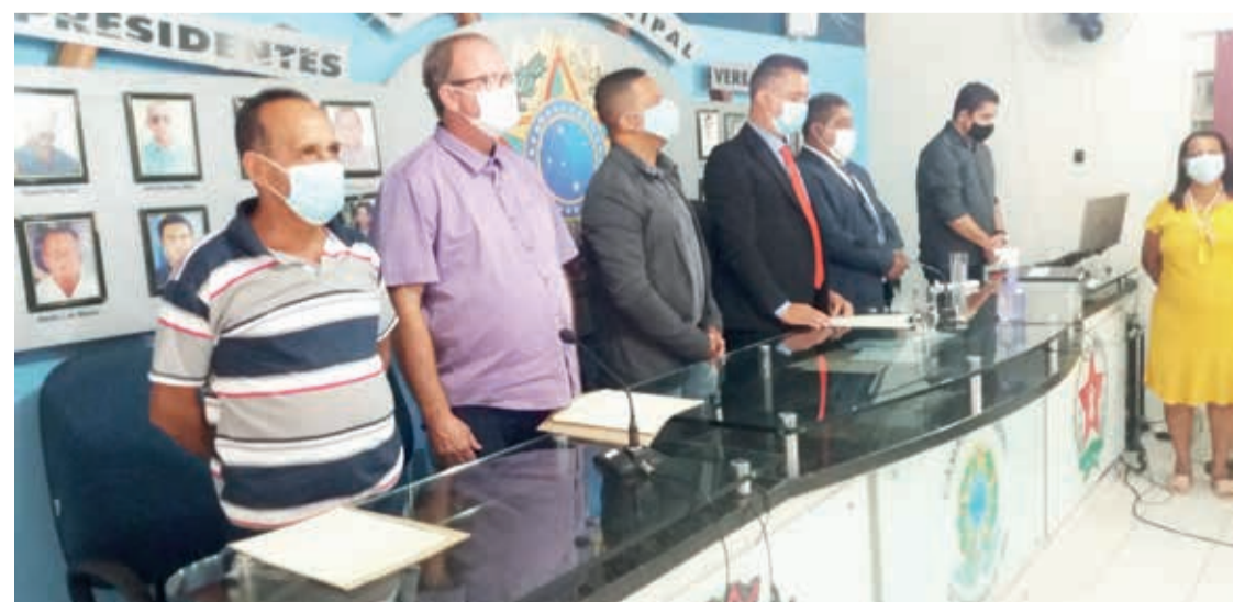
Execução do Hino Nacional Brasileiro durante a solenidade de posses