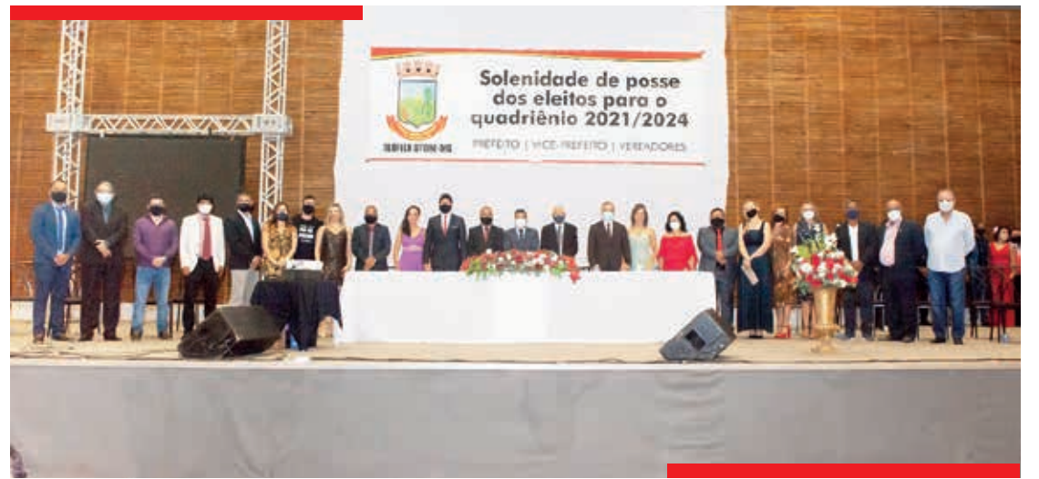
Novos empossados para a Gestão 2021-2024: Prefeito, Vice, Secretários Municipais e Mesa Diretora da Câmara Municipal de Teófilo Otoni