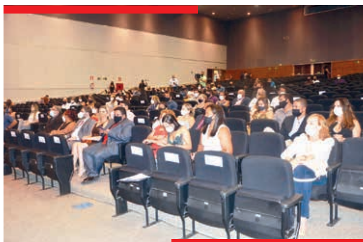
Solenidade de posses foi realizada no auditório do Expominas, na sexta-feira (01/01/2021)