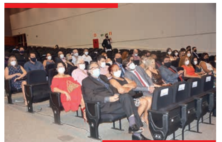
Secretários Municipais de Teófilo Otoni foram empossados na sexta-feira no Expominas