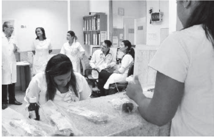
Norma engloba também os contratados temporariamente mas necessários ao combate à pandemia

O compartilhamento desses profissionais ainda contempla os planos de Contingência de Óbito; para a vacinação contra a Covid-19 e de Diagnósti-