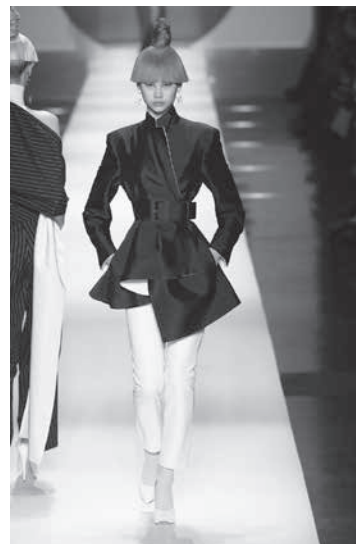
Pierre Cardin e algumas de suas criações