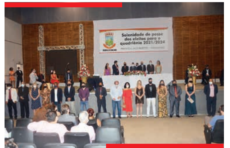
Momento do anúncio e apresentação dos secretários municipais de Teófilo Otoni