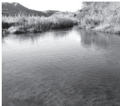
Cabeceira do Rio