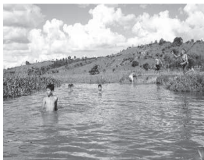
Garotos tomando Banho