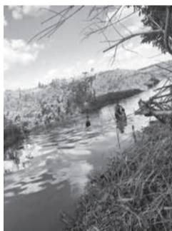
Rio já limpo

Textos de colonistas não refletem necessariamente a opinião desta Tribuna, que os publica visando estimular o debate sobre temas de interesse da sociedade regional e local.