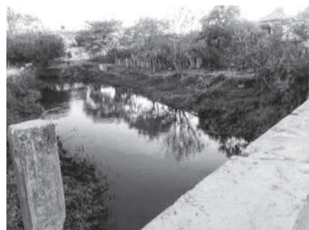
Na ponte da Divisa