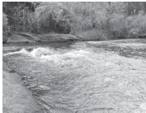
Cachoeira dos Ornelis