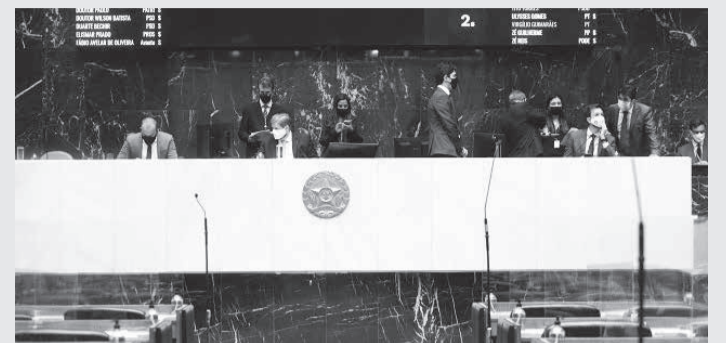
O projeto que originou a nova lei foi concluído na Reunião Extraordinária do Plenário em 4 de dezembro

O primeiro artigo inserido determina que sejam publicados, semestralmente, o número de Registros de Eventos de Defesa Social (Reds) e o de inquéritos policiais, instaurados e concluídos - com a especificação da taxa de elucidação - que