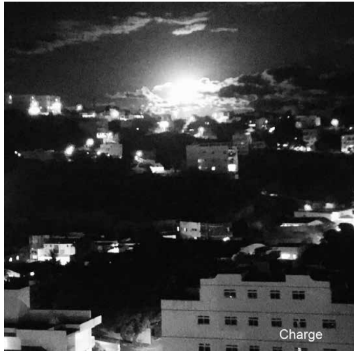
Foto: Teófilo Otoni vista do bairro Ipiranga às 19h29min do dia 30/Dezembro/2020 por Giovani Cota Fonseca