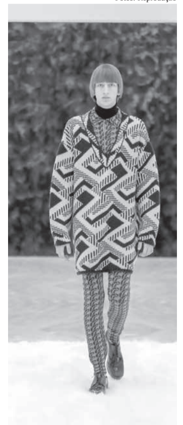
O masculino da Prada 2021