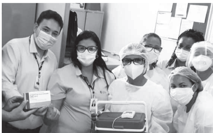
Profissionais da saúde do HSR recebem 1ª dose da vacina CoronaVac

Na quinta-feira (21/01), os profissionais do Hospital Santa Rosália, que estão na linha frente do combate à Covid-19, receberam a primeira dose da vacina CoronaVac. O imunizante, disponibilizado via Secretaria Municipal de Saúde, atende ao Plano de Imunização do governo federal alinhado ao governo do estado. A