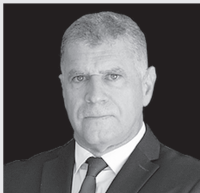
Rogério Greco, de 57 anos, foi procurador de justiça do MPMG por 30 anos

Mini currículo de dr. Rogério Greco: 57 anos, foi procurador de justiça do Ministério Público do Estado de Minas Gerais por 30