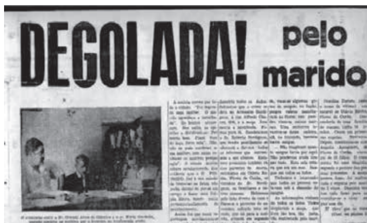
Mesmo sendo vítima, população questionava se uma mulher assassinada em 1951 não teria dado razão para o ex-esposo cometer o crime

Por outro lado, o ministro Rogério Schietti Cruz, do Superior Tribunal de Justiça (STJ), desqualificou a tese utilizada pela defesa de um réu que teria estrangulado sua esposa em uma festa no estado de Santa Catarina. O argumento utilizado para fundamentar a absolvição sumária considerou que o acusado teria assassinado a mulher em virtude de ela ter manifestado um comportamento considerado “repulsivo”, provocando com isso, seu marido. Situação que justificaria o reconhecimento da legítima defesa da honra. “[...] No recurso dirigido ao STJ, a defesa alegou que as atitudes da vítima ao longo de muitos anos causaram danos graves à honra do marido, deixando-o abalado psicologicamente e fazendo despertar a impulsividade e a violenta emoção que levaram à prática de ‘atos primitivos’”. Em resposta,