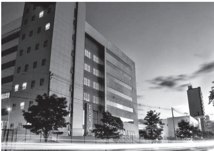
Decisão do Tribunal do Júri da Comarca de Uberlândia reconheceu culpa de acusada

Julgamento - A defesa sustentou que a acusada não tinha condições de avaliar o que fazia nem as consequências de seus atos no momento do crime, e pediu que ela fosse considerada inimputável ou pelo menos semi-imputável. Já o Ministério Público argumentou pela condenação da ré nos termos da pronúncia, que incluíam as três qualificadoras. O órgão afirmou que, de acordo com laudos médicos, ao tempo da ação, ela era inteiramente capaz de entender a gravidade e a ilicitude do ato. Ainda pode haver recursos. Acompanhe o anda-