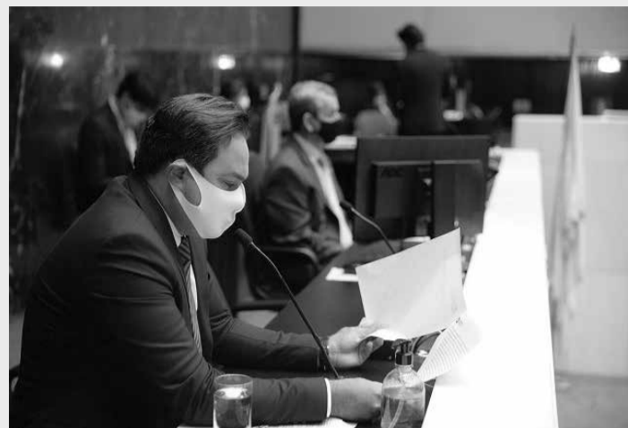
Para o deputado Repórter Rafael Martins (PSD), Minas está tratando a questão das vacinas de forma fria

O deputado Celinho Sinttrocel também pediu que o governo use o conhecimento da Funed para a produção de uma vacina em Minas, a exemplo do que estão fazendo a Fiocruz e o Butantan, no Rio de Janeiro e em São Paulo. “Minas perdeu essa chance e estamos num ritmo de vacinação mui-