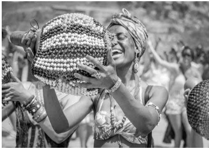
Evitar aglomerações e qualquer tipo de evento são algumas das recomendações da decisão

Comemorações e ponto facultativo no Estado estão suspensos e orientação é que todos os municípios façam o mesmo em MG