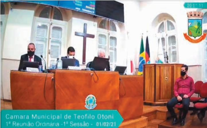
Câmara Municipal de Teófilo Otoni 1ª Reunião Ordinária - 1ª Sessão - 01/02/21

A Câmara Municipal de Teófilo Otoni realizou a 1ª semana de reuniões ordinárias de 2021, e na segunda-feira (1º/02), foram formadas oito comissões permanentes da Casa Legislativa. Após discussão e votação, por unanimidade dos presentes, todas as comissões terão 5 membros efetivos. Página 2