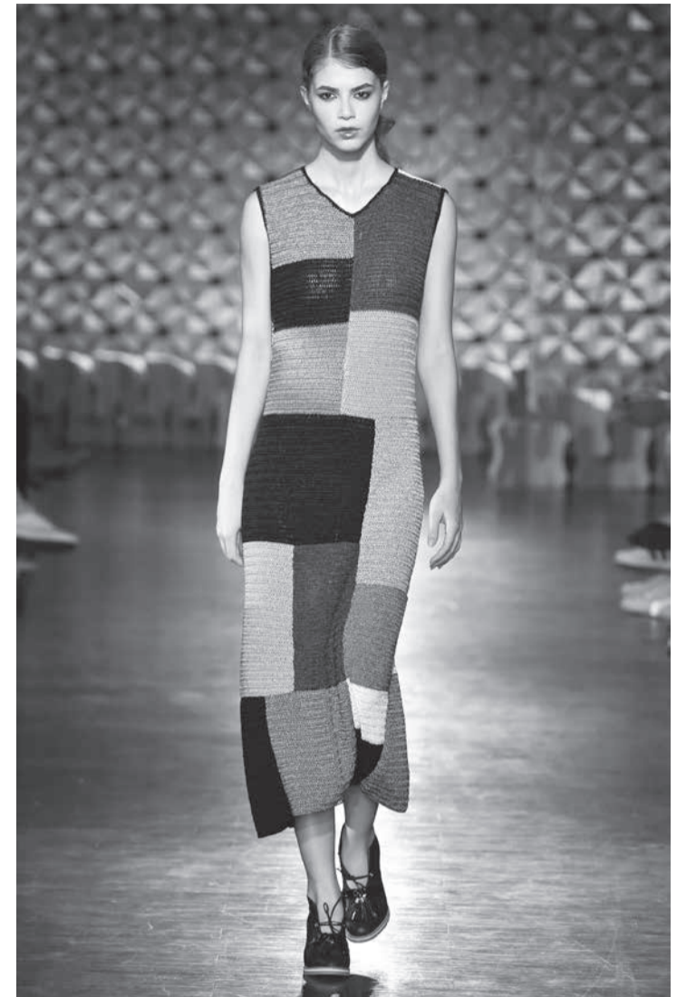
A nova moda é artesanal &amp; sustentável

* Um grupo de estilistas de Beagá, vai oficializar a constituição de sua nova entidade, a A.Criem – Associação dos Criadores e Estilistas de Minas Gerais - em reunião no Sindinvest-MG.