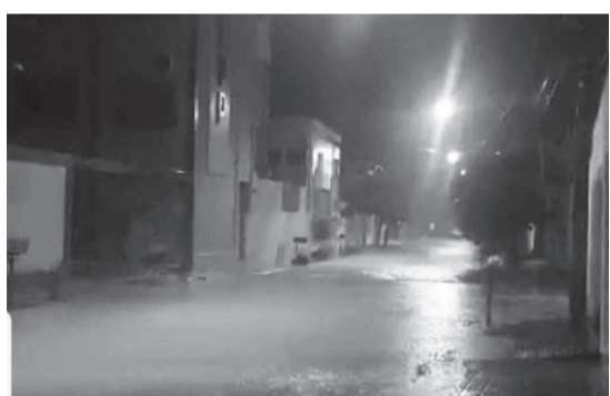
Rua José Luiz Tanure