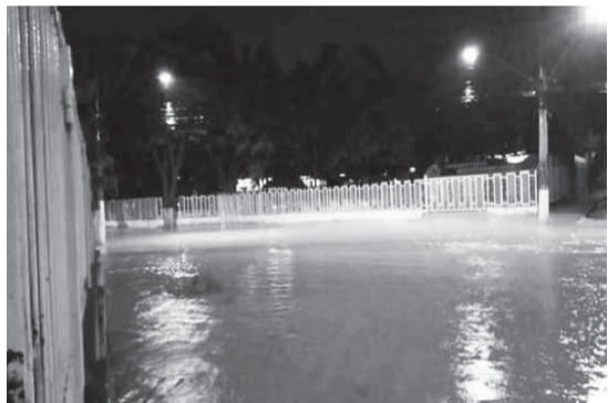
Rua da Unipac