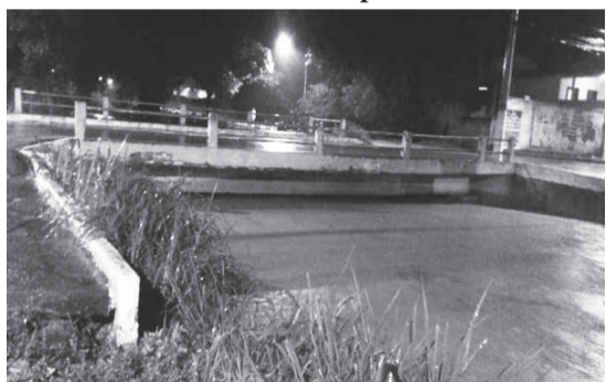
Bairro Castro Pires