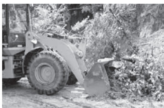
Delizamentos de terra

As fortes chuvas que caíram em Teófilo Otoni no último sábado (20/02) causaram alagamentos em várias ruas da cidade e inundações em algumas casas de diversos bairros. Em alguns locais a situação foi mais crítica, casas foram invadidas pelas águas, deixando algumas famílias sem os seus pertences, mas felizmente ninguém se feriu. O Rio Todos os Santos encheu bastante, e no Bairro Castro Pires a água quase encostou na cabeceira da ponte.