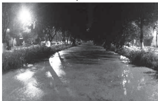
Rio Todos os Santos