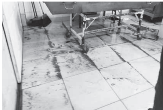
IML Teófilo Otoni