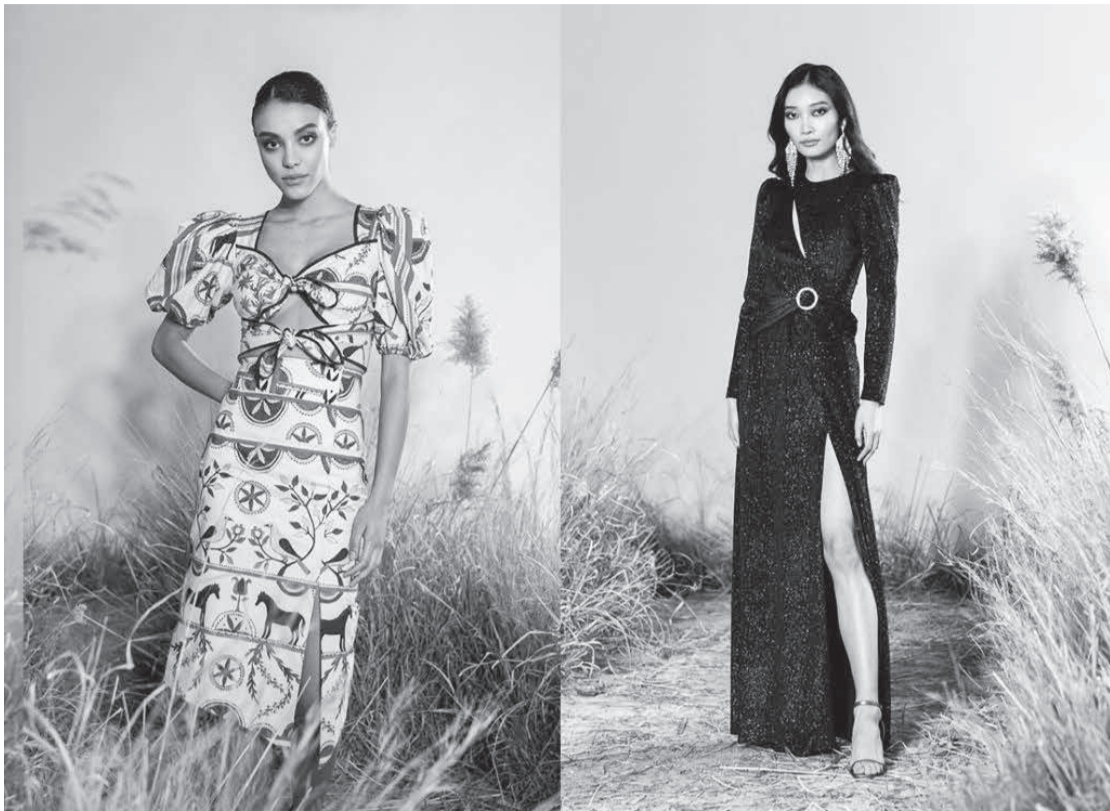
A moda da PatBo em Nova York