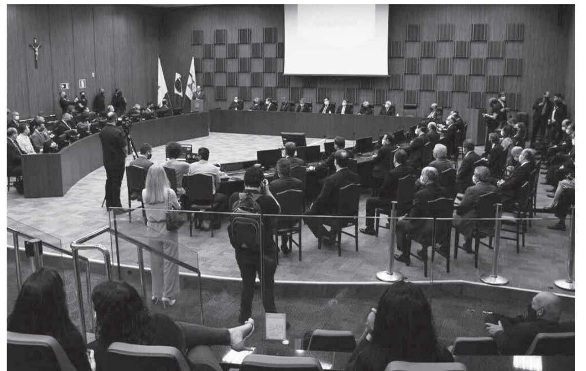
Parceria entre o Poder Judiciário e órgãos de controle foi formalizada com assinatura de uma Portaria Conjunta, instituindo um Comitê Interinstitucional

O presidente do Senado Rodrigo Pacheco disse que o Programa Destrava Minas é de uma inteligência singular muito necessária para combater um grande problema que temos, não só em Minas, mas em todo o Brasil, que é o das obras paralisadas. É preciso dar continuidade a essas obras em um País