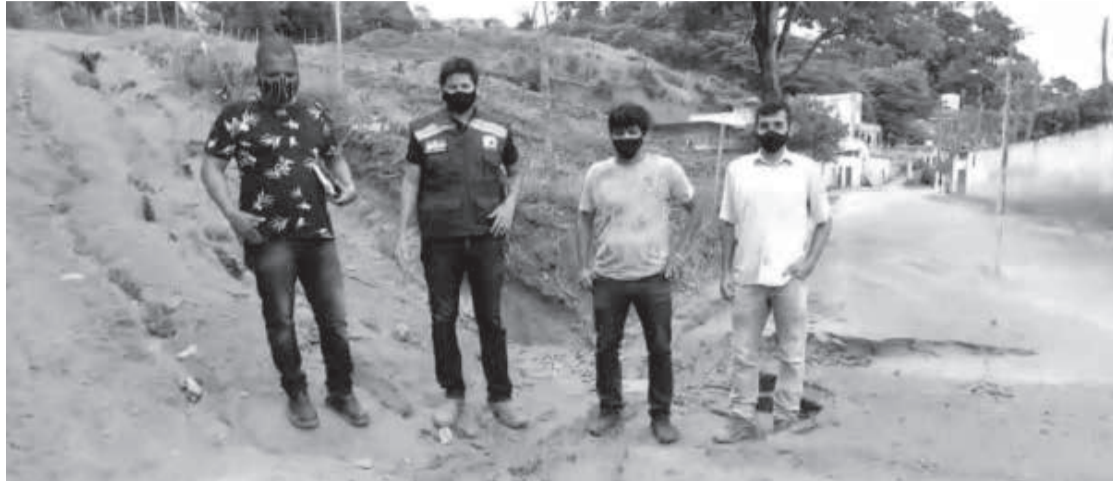
Prefeito e secretários fazendo vistorias em áreas atingidas pela chuva