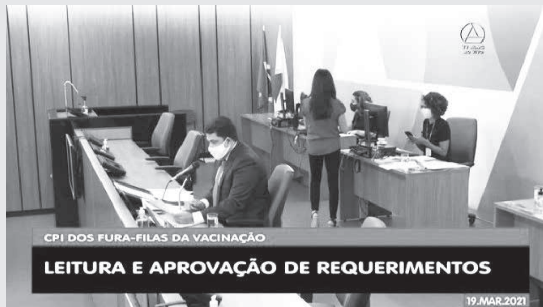
Primeiros requerimentos da CPI dos Fura-Filas da Vacinação foram aprovados por unanimidade

Deputados aprovaram requerimentos para colher depoimentos de autoridades, realizar audiências e solicitar documentos