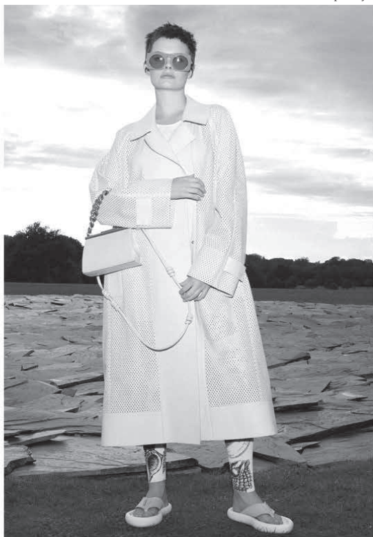
Propostas de Stella McCartney, ícone da moda sustentável