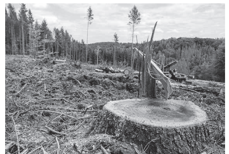
Na propriedade onde ocorreu o desmatamento, existiam quatro fornos de fabricação de carvão, evidenciando a atividade e o comércio ilegal